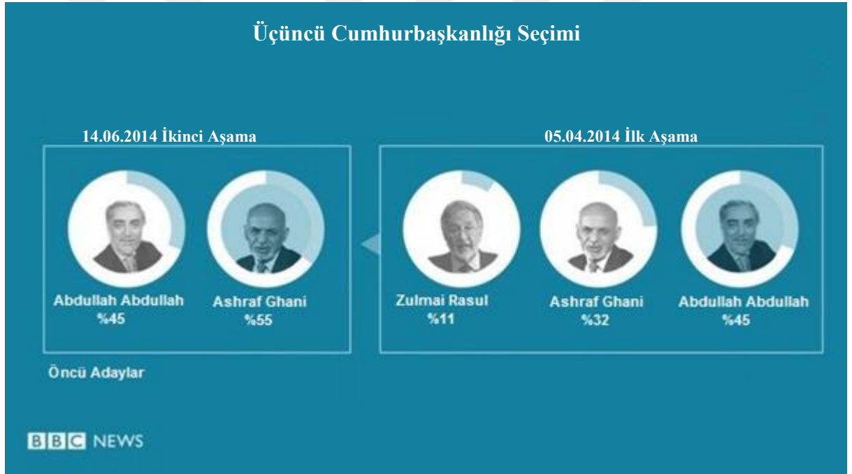
Resim 2, Afganistan'da üçüncü cumhurbaşkanlığı seçimi

Üçüncü Cumhurbaşkanlığı seçiminin ilk aşamasında adaylardan hiçbiri oyların çoğunluğunu (50+1) sağlayamadı. Seçim ikinci tura ertelendi. İkinci aşamada ise sonuç rakip parti tarafından kabul edilmedi ve herkesin iç savaş çıkmasından korktuğu bir krize girildi. Nihayet ABD'nin Dışişleri Bakanı John Kerry arabuluculuğuyla ulusal birlik hükümeti kuruldu. Anlaşma sonucunda cumhurbaşkanlığına Dr. Eşref Gani Ahmedzai ve İcra Başkanı olarak Dr. Abdullah Abdullah getirildi. Ancak daha sonra taraflar arasında anlaşmanın yorumlamasında farklılık ortaya çıktı. Eşref Gani anlaşmayı güç paylaşımı olarak kabul etmemişken, Abdullah Abdullah ise gücün yarı yarıya paylaşıldığını savunmuştu. Her iki tarafta anlaşmayı kendi lehlerinde yorumlamak istiyordu. 260