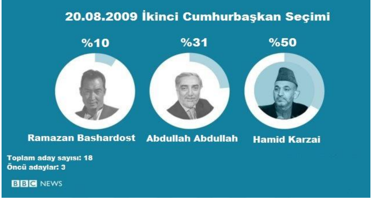
Resim 1, Afganistan'da ikinci cumhurbaşkanlığı seçimi