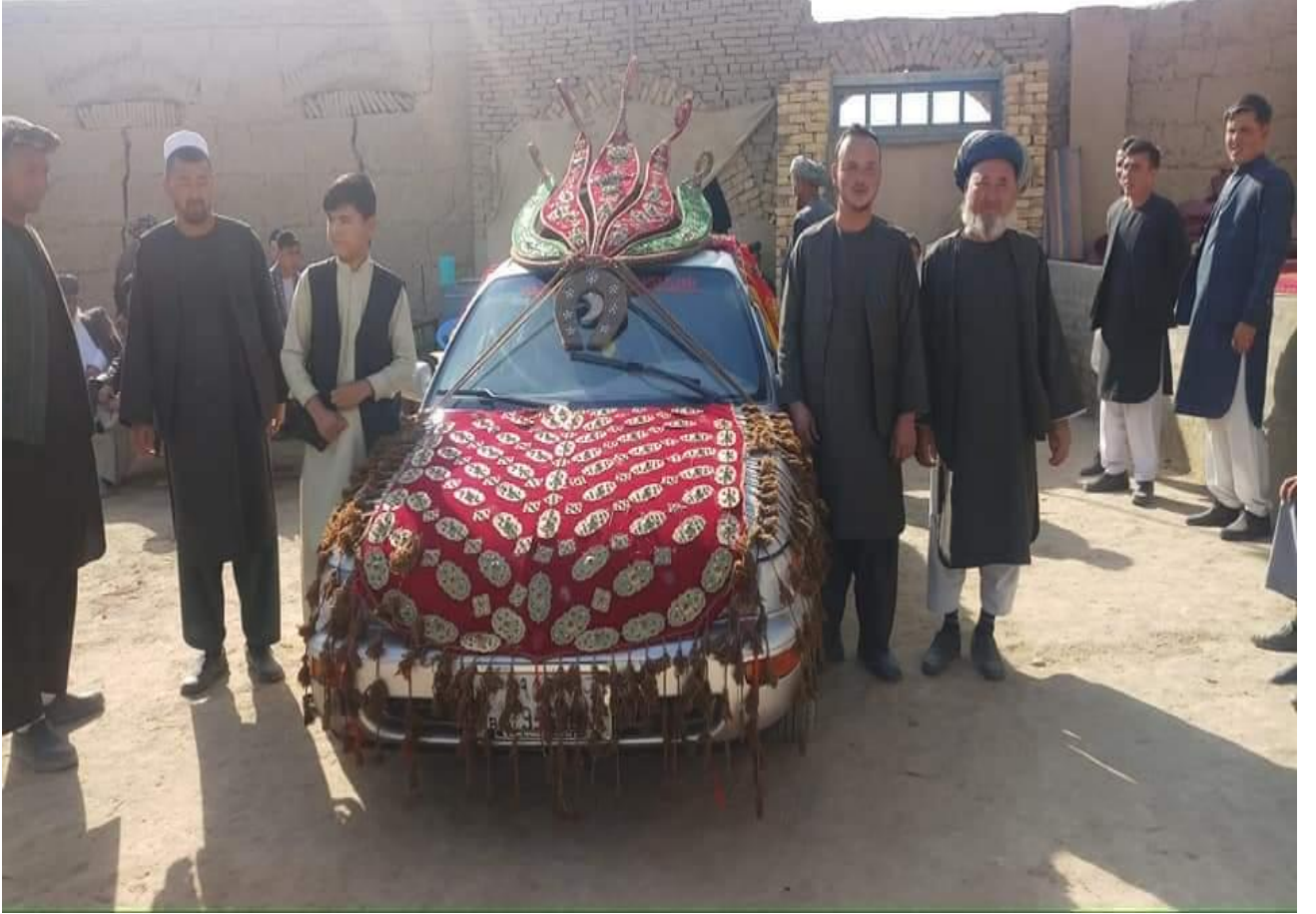
6) (Gül Poş) Gelini getirmek için süslenen Araba