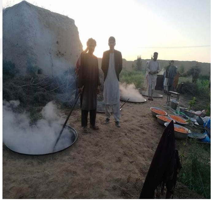
10) Etli Türkmen Pilavının hazırlanışı