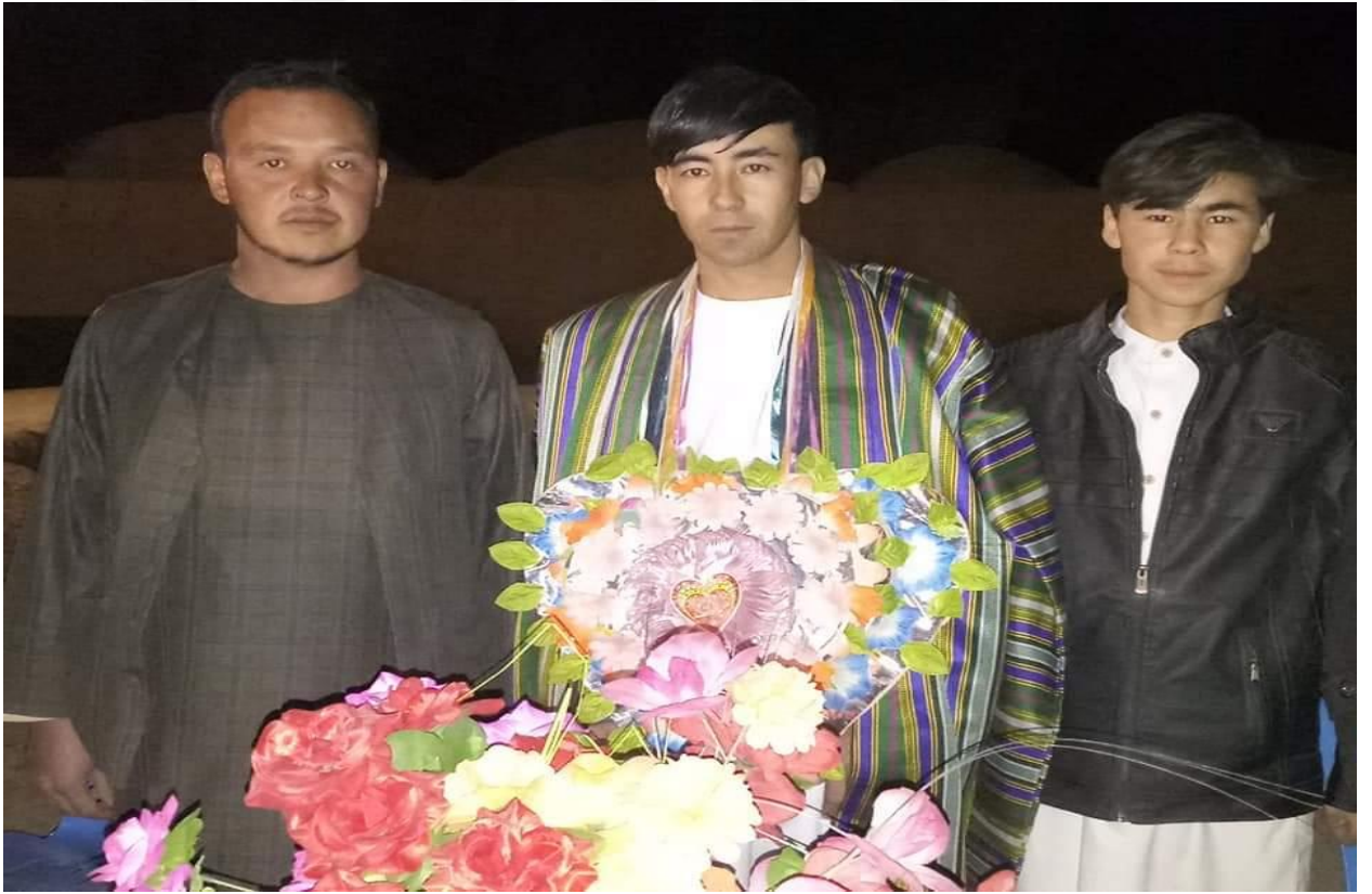
9) Türkmen damatları