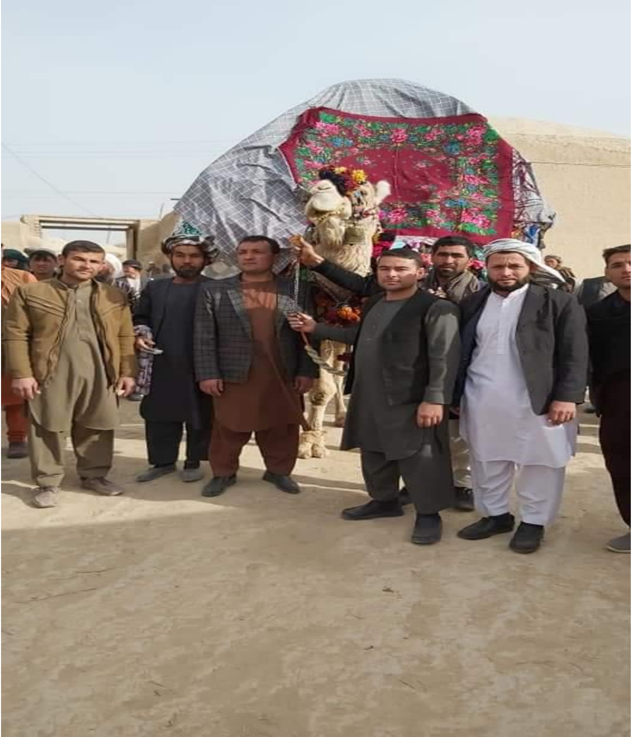
5) Hançarbağ Türkmenlerinin Kecebeyi süsleyip gelini almaya gitmeden önce çekilen resmi