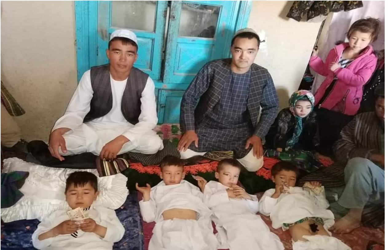
8) Çocukların sünnet olduktan sonraki hali