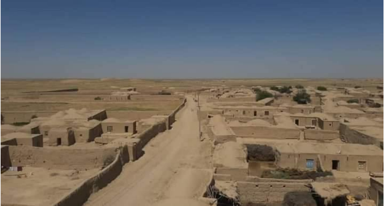
11) Andhoy Bölgesindeki Türkmen Köylerinden Görüntüler