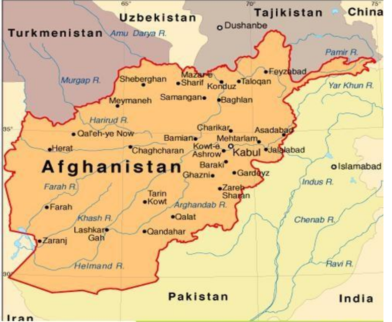
1) Afganistan'ın sınırlarını ve komşularını gösteren harita.