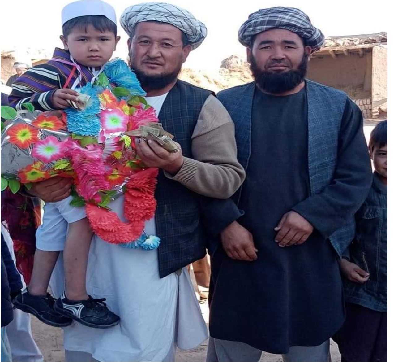
7) Sünnet olacak çocuğa kesme korkusunu gidermek için para verilir.