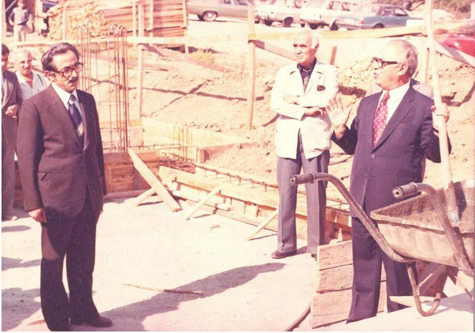
Öğrencisi Hüsni Hüseyin TEKİŞİK İlkokulu'nun (Ankara) Temel Atma Töreni