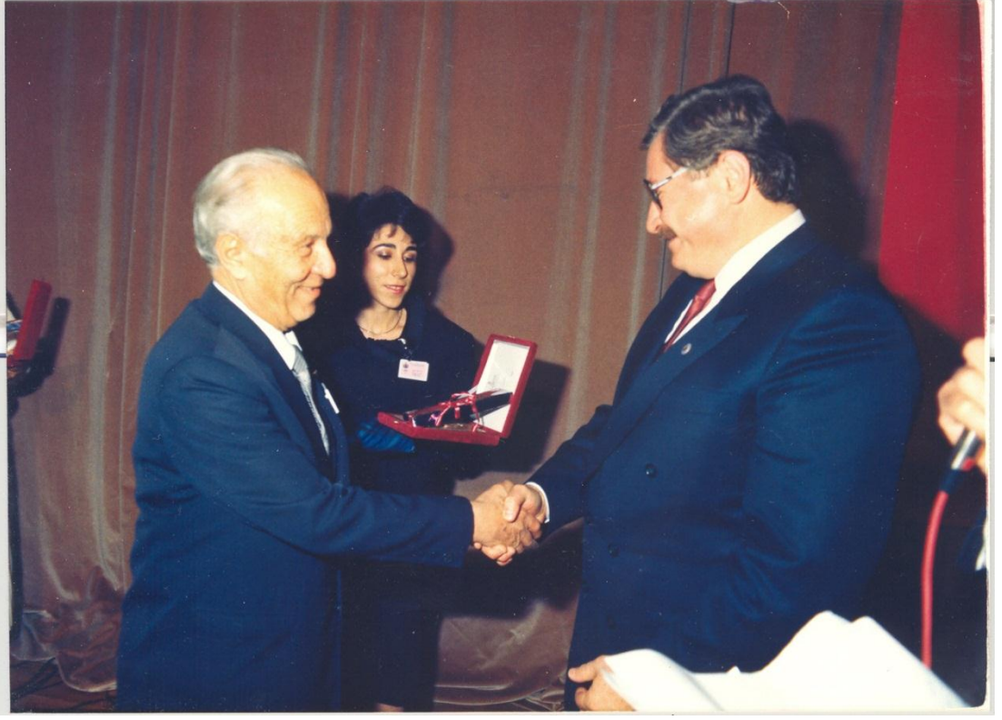
Millî Eğitim Bakanı Hasan Celal Güzel ile beraber (1987)