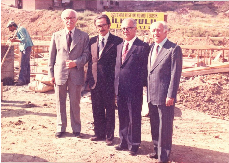
Öğrencisi Hüsnu Hüseyin TEKIŞIK İlkokulu'nun (Ankara) Temel Atma Töreni