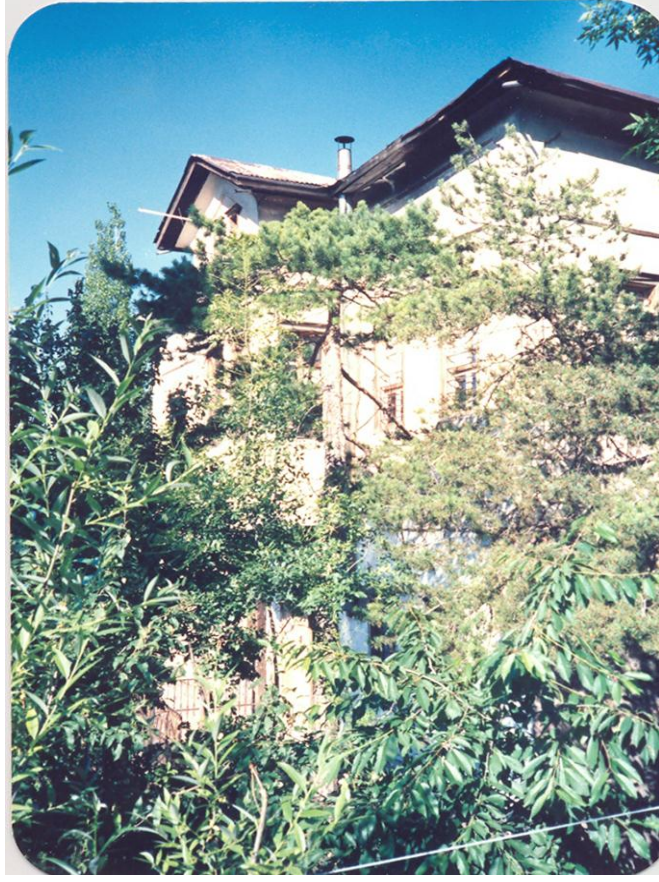
Şiirlerine Konu olan Şebinkarahisar'daki Konak