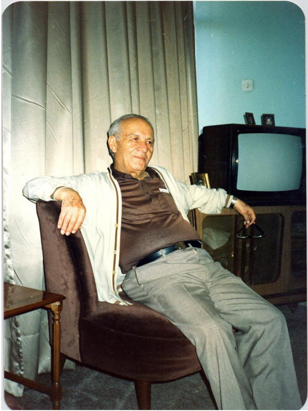
Ankara Bahçelievler’de Kendi Evinde