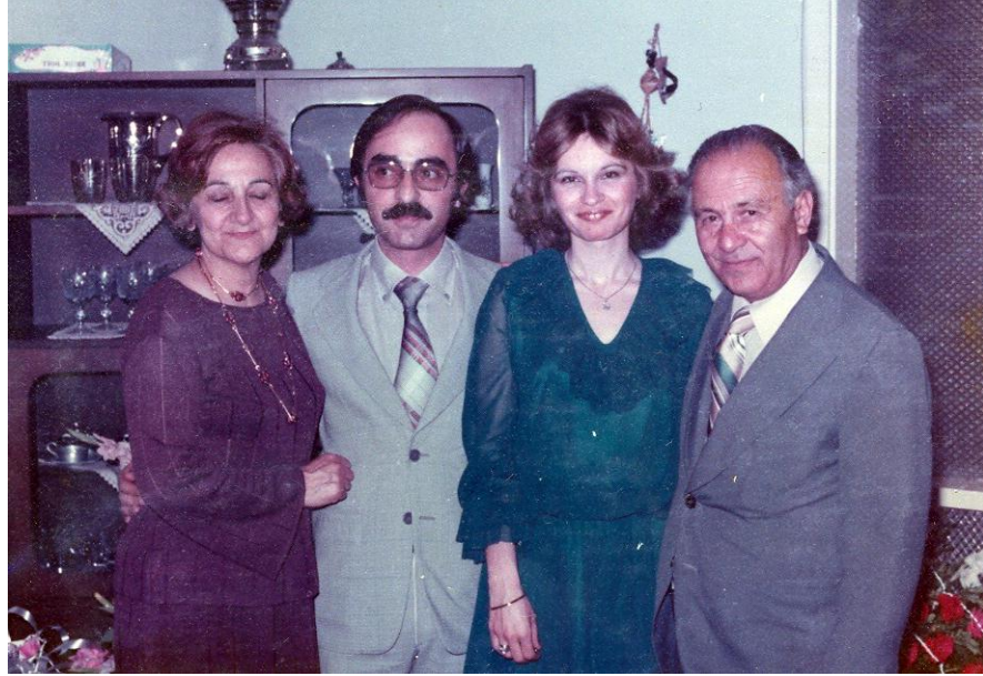
Ođlu, Gelini, Kendisi ve Eşi