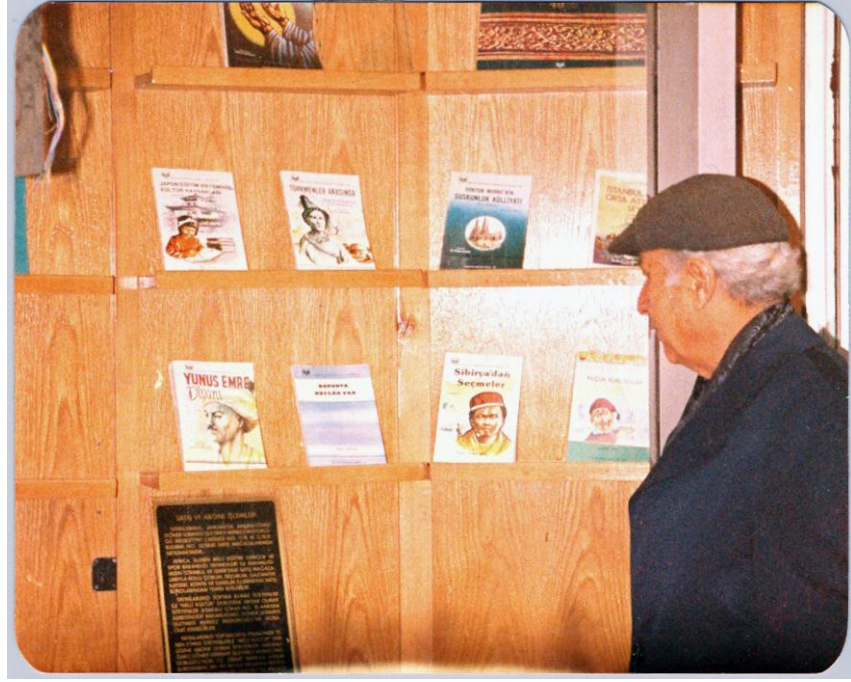
“Dorukta Rüzgâr Var” kitabının 1986 yılı Ocak ayında Kültür ve Turizm Bakanlığı vitrinlerine konulduğu gün çekilen fotoğrafı ve fotoğrafın arkasındaki el yazısı

Dorukta Rüzgâr Var 'ın Kültür ve Turizm Bakan- lığına vitrinlerine konul- duğu gün. 15 Ocak 1986