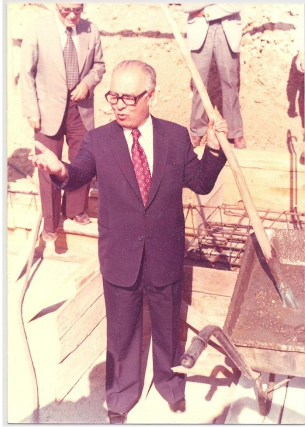
Öğrencisi Hüsnu Hüseyin TEKIŞIK İlkokulu'nun (Ankara) Temel Atma Töreni