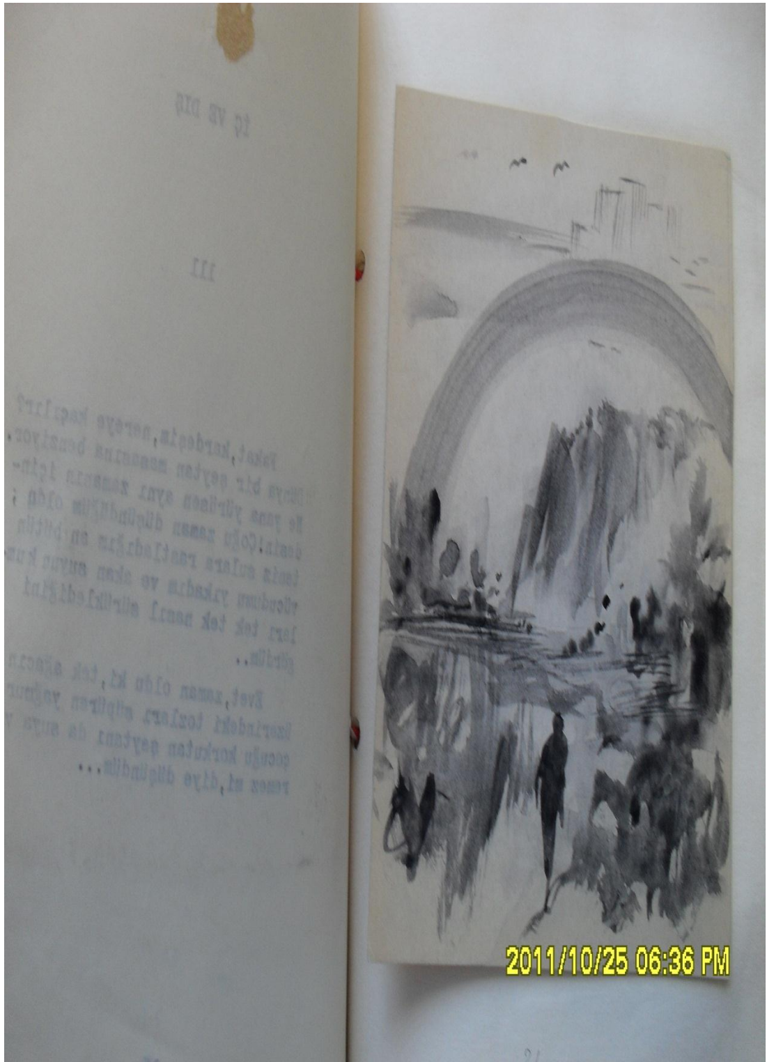
“TEK ADAM” kitabının basım öncesi iç sayfa örneği