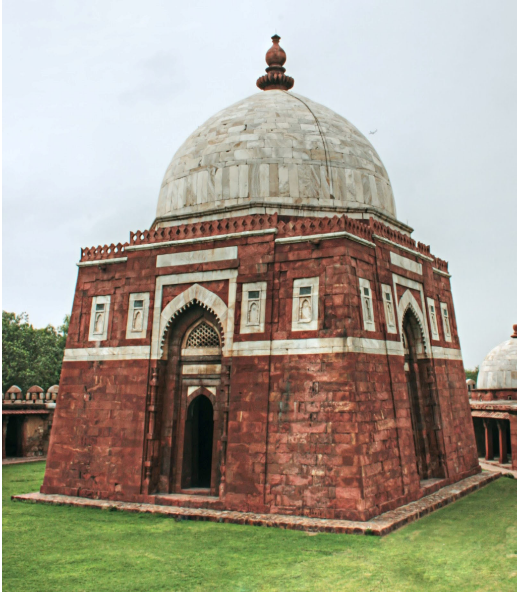
Resim 3.1 Ghiyaseddin Tuęluk Őah'ın Trbesi, Dehli.

( https://rangandatta.files.wordpress.com/2018/04/ghiyasuddin-tughlaq-tomb-1.jpg )