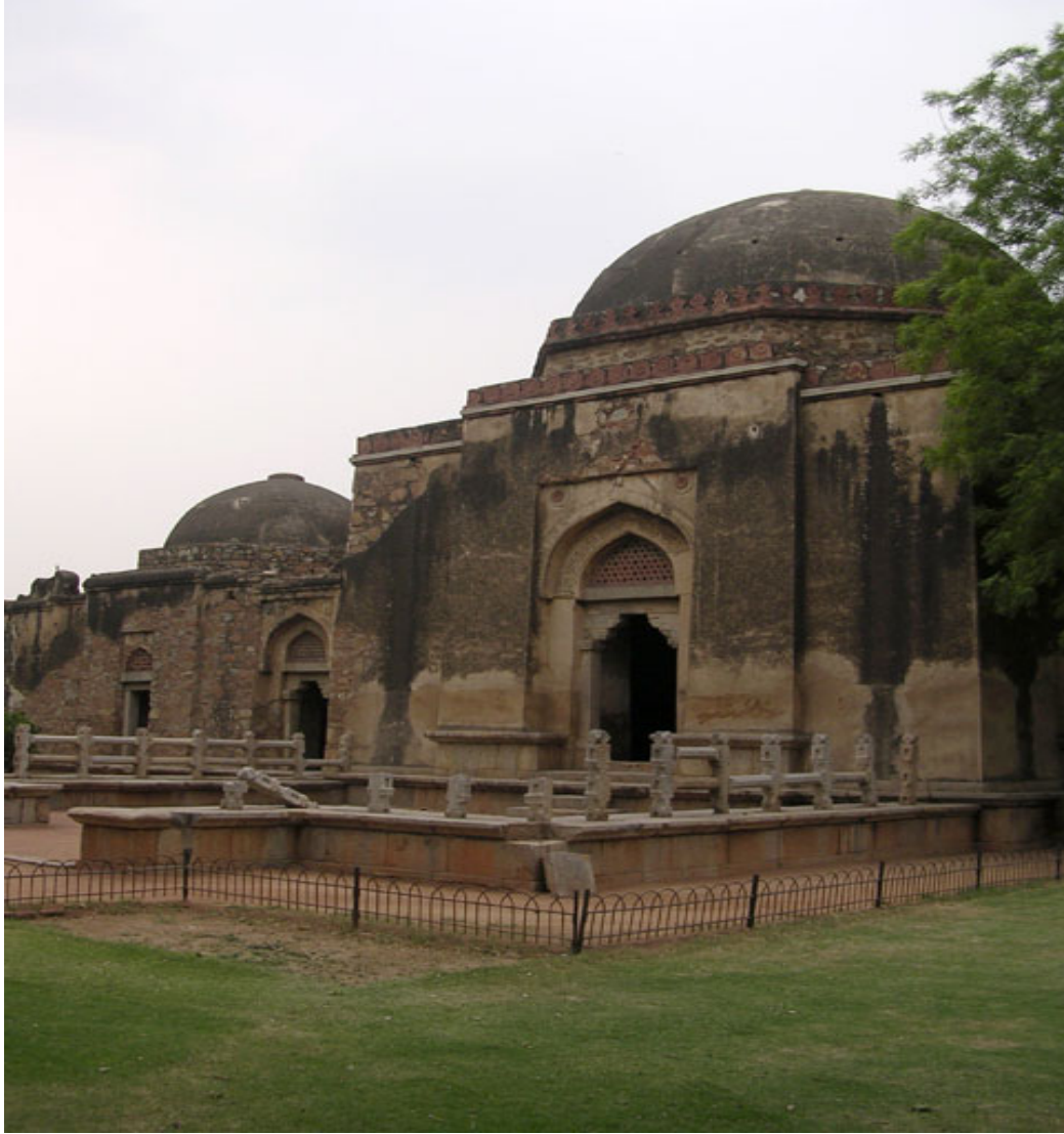
Resim 3.3 Sultan Firuz Tuğluk Türbesi, Dehli.

Sultan Firuz Tuğluk döneminde inşa edilen yapı sayısı: elli baraj, elli cami, otuz mescitli medrese, yirmi saray, yüz kervansaray, ikiyüz kasaba, otuz sulama gölü, bir hastane, yüz hamam, on anıt, on su kuyusu, yüzelli köprü, çok sayıda bahçe ve ev. 388