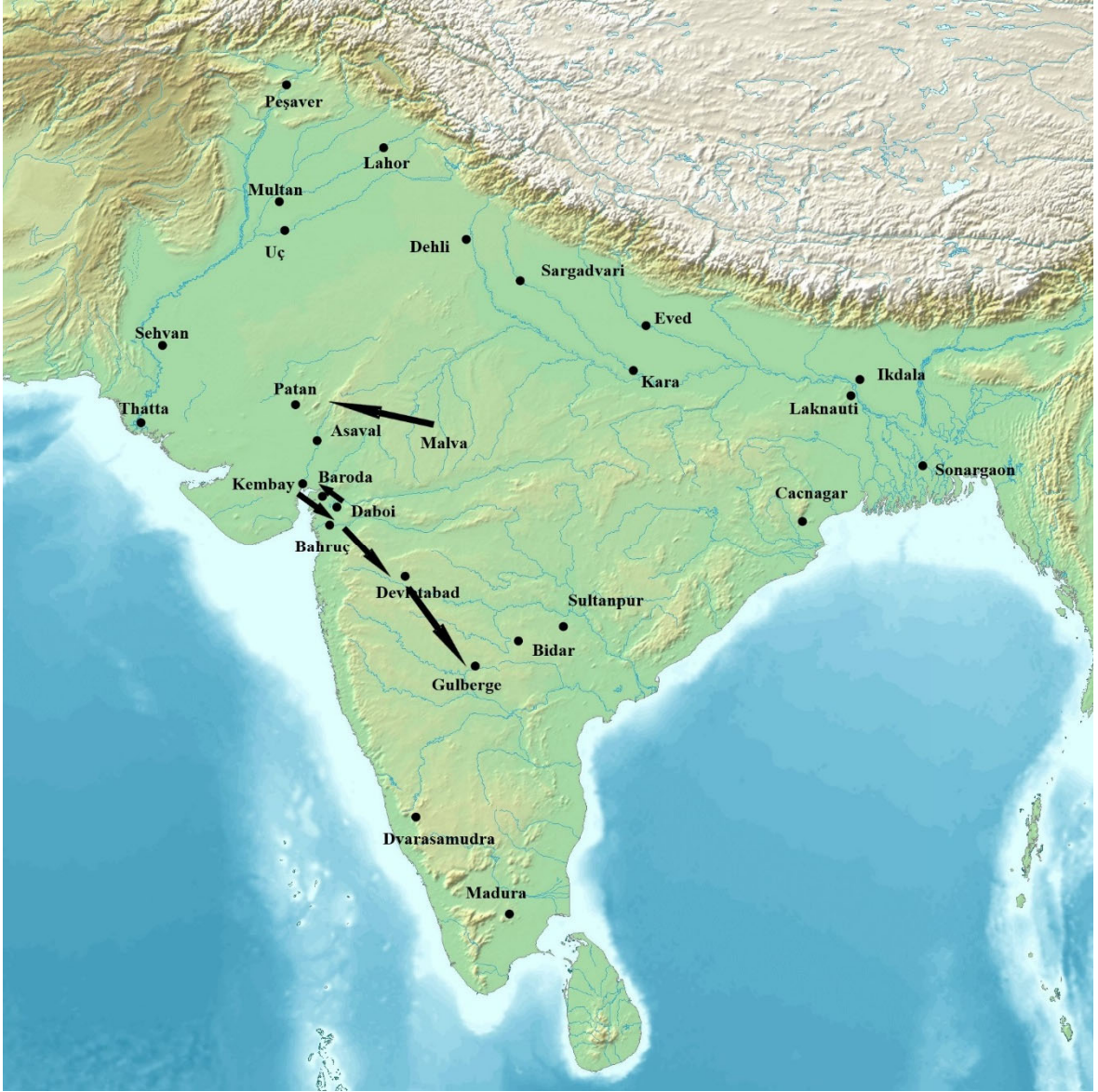
Harita 3.2. Sultan Muhammed Tuğluk Dönemindeki Emiran-ı Sadah isyanlarının yönünü gösterir harita.

( https://en.m.wikipedia.org/wiki/File:South_Asia_non_political_with_rivers.jpg )