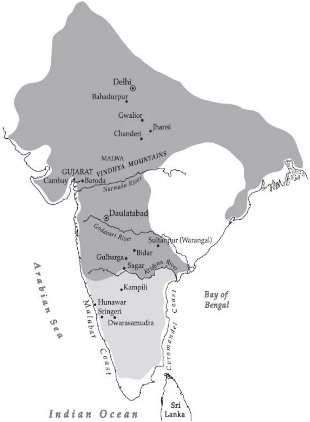
Harita 3.1. Gıyaseddin Tuğluk Dönemi Tuğluklu hâkimiyeti sınırlarını gösterir harita. ( https://hyderabadhistory.wordpress.com/2015/03/24/warangal-to-sultanpur/tughlaq-map/ )