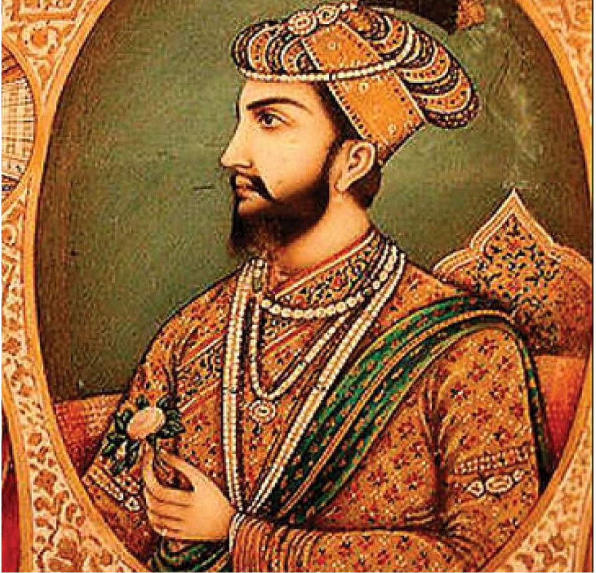
Resim 3.2 Sultan Muhammed Tuğluk.

( https://www.dnaindia.com/analysis/column-tughlaq-s-taxes-and-delhi-sultanate-s-decline-2552863 )