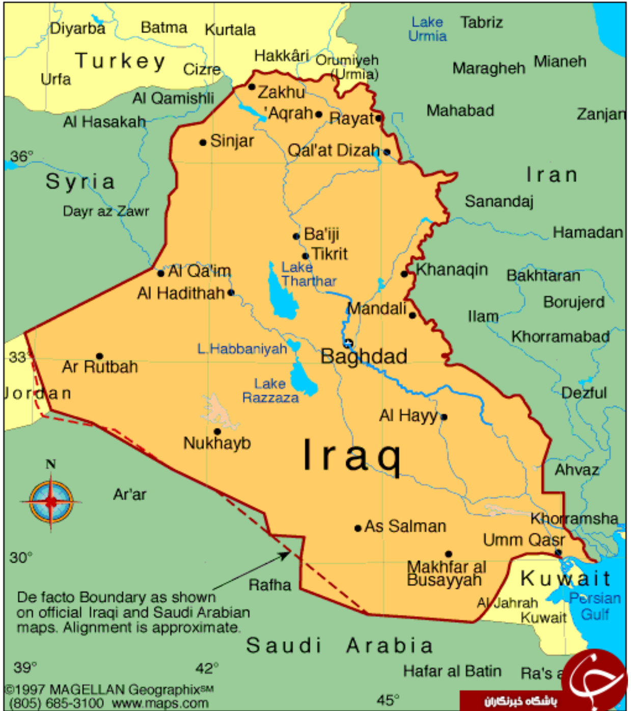
2) Irak'ın şehirleri ile sınırlarını ve komşularını gösteren harita.