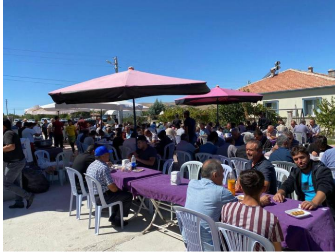
Fotoğraf 15: Cuma Namazından Sonra Erkeklerle Yapılan Yemek servisi

Mezarlık ziyaretleri Türklerin yüzyıllar boyunca önem verdiği ritüellerdendir. Ölen kişinin anılması, ona dua edilmesi mezarlık ziyaretleri boyunca yapılır. Tanımasalar bile eserlerini gördükleri insanların, dervişlerin, önemli olduğunu düşündükleri kişilerin mezarlarını bile ziyaret eden insanlar, vefat eden yakınlarının mezarlarını da düzenli olarak ziyaret etmektedir.