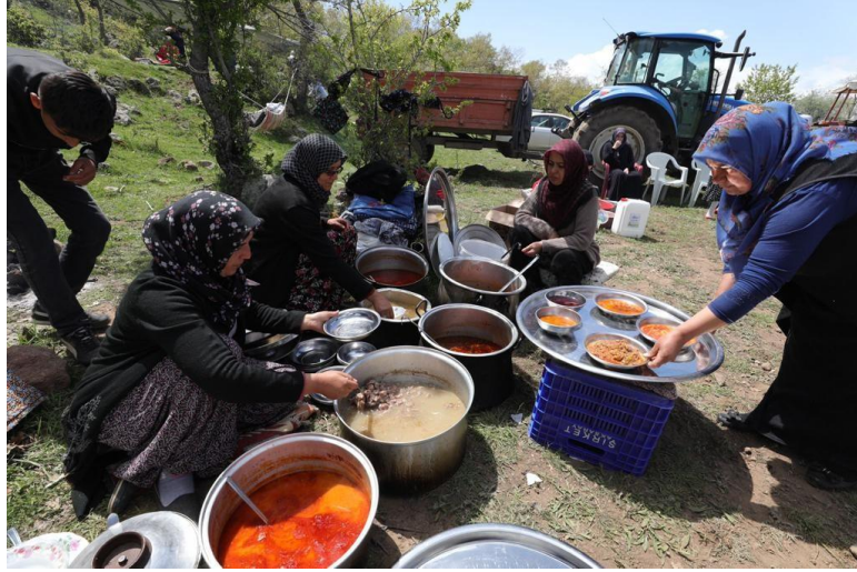
Fotoğraf 17: Hıdırellez zamanı Komşuların Birlikte Hazırladıkları Yemek