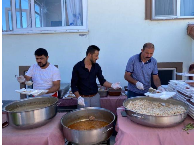
Fotoğraf 14: Ekmek ıkarma/Ölüyü Anmak İin Verilen Davette İkram Edilen Yemekler.