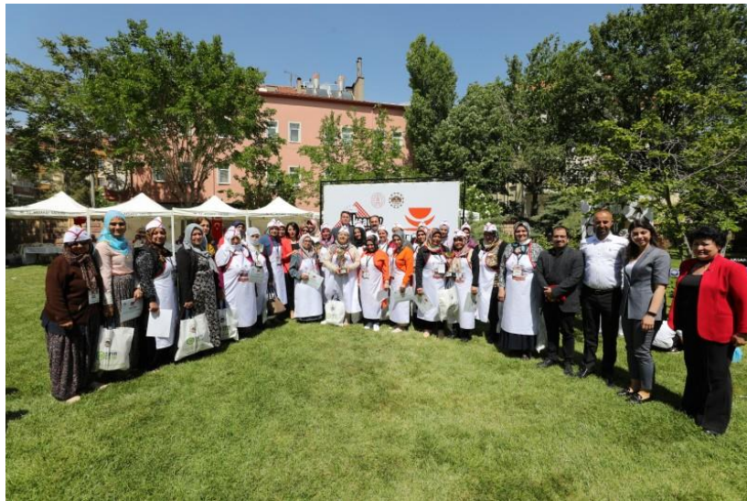
Fotoğraf 46: Aksaray Yöresel Yemek Yarışması, Yarışmacılar ve Jüriler

Aksaray'da bu yıl 5.si düzenlenen yemek yarışması otuz altı yarışmacı ve konusunda uzman beş jüri üyesi katılımıyla Aksaray Kültür Evi bahçesinde gerçekleşmiştir. Yarışmanın katılımcılarının hemen hemen hepsi ev hanımıdır, erkek katılımcı bulunmamaktadır. Önceki yıllarda yapılan yemek yarışmalarındaki yemek ve tatlı olmak üzere iki farklı kategoride değerlendirme yapılırken son yarışmada tatlı kategorisi kaldırılmıştır. Yarışmada sunulan yemekler katılımcıların önceden pişirip yarışma alanında ısıtarak sunduğu yemeklerdir. Yarışmanın kazananına verilen ödüllerin yanında her katılımcıya katılım belgesi verildiği görülmüştür. Aynı zamanda katılımcılara önlük ve kep de verilmiştir.