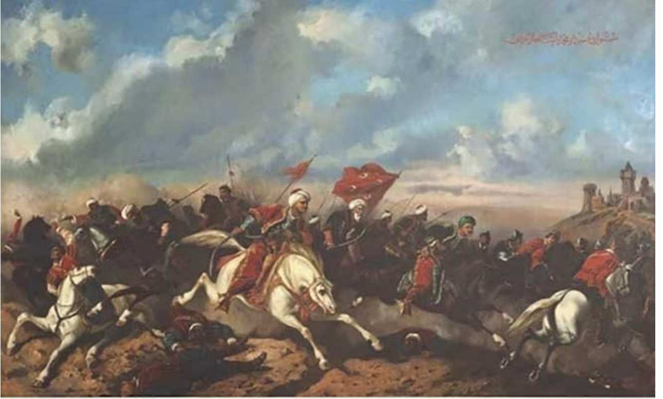
EK 1. Sultan Abdülaziz'in eskizi üzerinden Stanislav Chlebowski'nin çizimi.