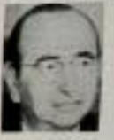
Ecevit'in 'halkı yokluğundan kurtaracağız'