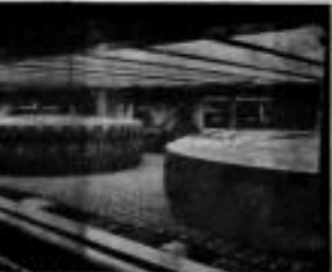
LANTILALI TUNCU - Fotoğrafçı grevden, elektrik kesildiği için çalışamadı. Bu nedenle fotoğrafçıların grevden dolayı çalışmadığı görülmektedir.

Belediye başkanları ve yöneticileri hakkında yapılan şikâyetler son zamanlarda artış göstermiştir. Özellikle belediye başkanları hakkında yapılan şikâyetler son zamanlarda artış göstermiştir.