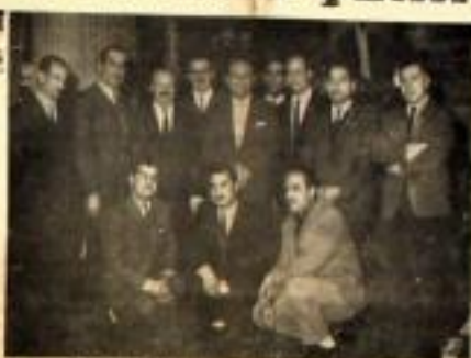
Başbakan Demirel'in Cihanbeyli'de hayvan hastanesi ve tuz fabrikasının yapılmasını istediği anı.

Başbakanın Cihanbeyli'de Hayvan Hastanesi ve Tuz Fabrikasının Yapılması İstendi Şehrimizden Ankara'ya giden Başbakan Süleyman Demirel, Cihanbeyli'de hayvan hastanesi ve tuz fabrikasının yapılmasını istedi.