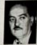
Okuyan, 'hakkında konuşurken de uğurlandı, dedi'

Ecevit Konya'da 'Ortanın Solu'nu anlatıyor. Ecevit Konya'da 'Ortanın Solu'nu anlatıyor.