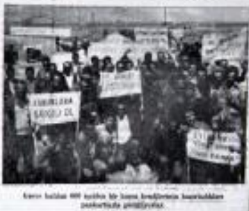
Konu hakkında 600 işçiden bir kısmı tarafından hazırlanan bildirinin bir kısmı.

SEYDİŞEHİR (Özaj) Seydişehir Alüminyum İşletmesinde Mortaş Boksit İşletmesinde çalışan 600'e yakın işçi toplu sözleşmeye gelmemesi yüzünden greve girdi. İşçilerin işverenler ile 2 ay önce yapılan sözleşme görüşmelerinde bir türlü anlaşmaya varamadıkları için Mortaş Boksit İşletmesinde çalışan işçiler toplu sözleşmeye gelmemesi yüzünden greve girdi. İşçilerin işverenlerle yapılan görüşmelerde bir türlü anlaşmaya varamadıkları için Mortaş Boksit İşletmesinde çalışan işçiler toplu sözleşmeye gelmemesi yüzünden greve girdi.