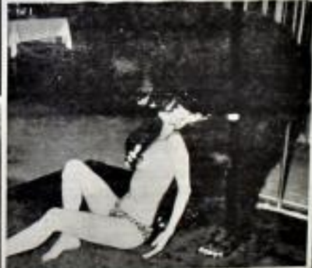
Garil kadını soyarken nefesler kesildi