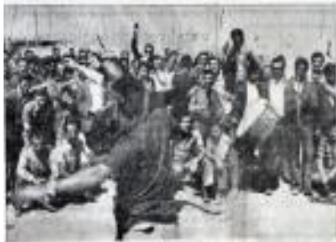
Dün Seydişehir Alüminyum işçileriyle birlikte greve katılan işçiler.

SEYDİŞEHİR (Özaj) Seydişehir Alüminyum İşletmesinde Mortaş Boksit İşletmesinde çalışan 600'e yakın işçi toplu sözleşmeye gelmemesi yüzünden greve girdi. İşçilerin işverenler ile 2 ay önce yapılan sözleşme görüşmelerinde bir türlü anlaşmaya varamadıkları için Mortaş Boksit İşletmesinde çalışan işçiler toplu sözleşmeye gelmemesi yüzünden greve girdi. İşçilerin işverenlerle yapılan görüşmelerde bir türlü anlaşmaya varamadıkları için Mortaş Boksit İşletmesinde çalışan işçiler toplu sözleşmeye gelmemesi yüzünden greve girdi.