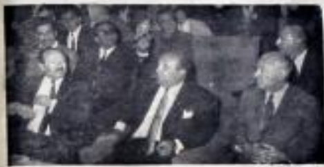
1966, Yeni Konya - Bu fotoğrafta Demirel'in AP il kongresinde bir konuşma yaptığı görülüyor.