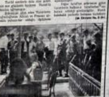
Şehirli san gülerde Turistlerle buluşmakta ANA Halkımız Turistleri rahat bırakmamakta.