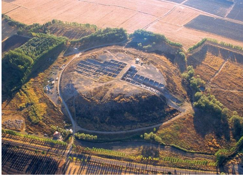
Figür-1. Kaman Kalehöyük