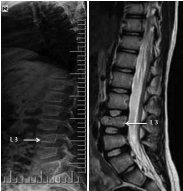
Resim 2. Lomber lateral grafi de L3 vertebrada yükseklik kaybı ve T2 ağırlıklı manyetik rezonans görüntüsünde korpusunda medüller ödem, sinyal artışı

Çocukluk çağında sekonder osteoporozun tedavisi en iyi şekilde altta yatan hastalığın tedavisi ile sağlanabilir (19). Vertebral kırık gelişen hastalarda ise ek olarak akut dönemde uygulanan istirahat, splintleme sonrasında terapatik egzersizler hastaya spesifik olarak kemik, kas gücü ve fleksibilitiyi arttıracak ayrıca aerobik kapasiteyi de koruyacak ve arttıracak şekilde planlanmalıdır (20). İH'li hastalarda diyetle kalsiyum kısıtlamasının üriner kalsiyum atılımını azaltmadığı gösterilmiştir. Bu nedenle büyüme çağına olan çocuk hastalarda diyetle kalsiyum kısıtlaması yapılmamaktadır. Üriner kalsiyum atılımı üriner sodyum atılımı ile ilişkili bulunmuştur. Hastalara sodyum kısıtlı diyet önerilerek idrar kalsiyum atılımı azaltılabilir (19).