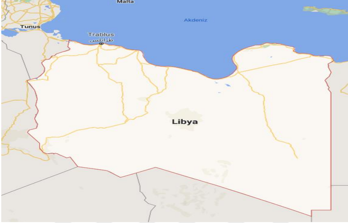
Şekil 5: Libya Haritası