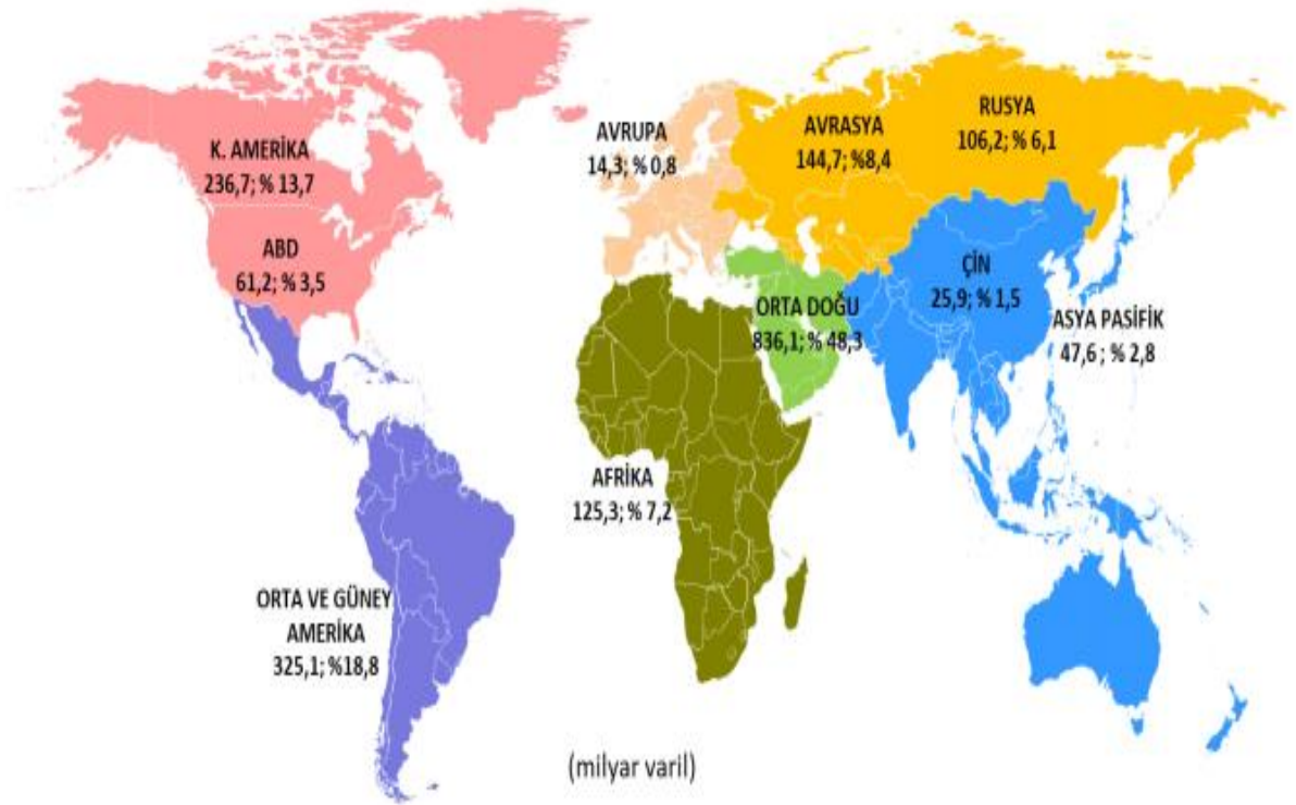
Tablo 4: Dünya Petrol Üretim Bölgeleri