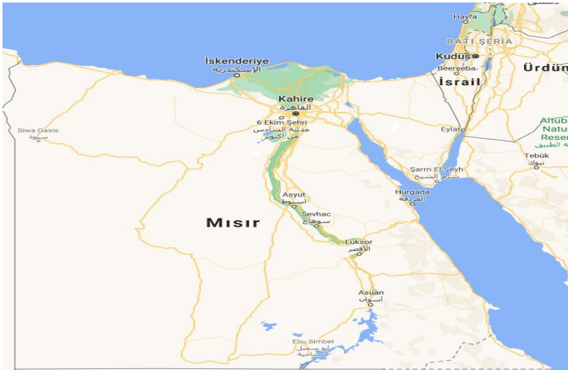
Şekil 4: Mısır Haritası