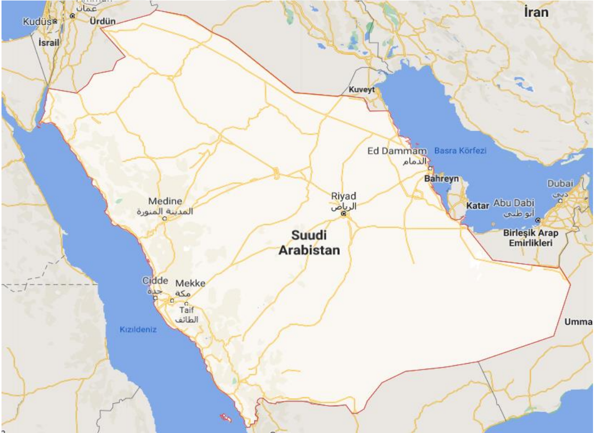
Şekil 1: Suudi Arabistan Haritası