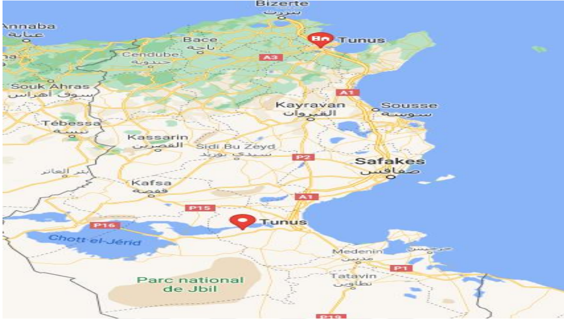
Şekil 3: Tunus Haritası

Kaynak: http://www.arasikackm.com/m/tunus