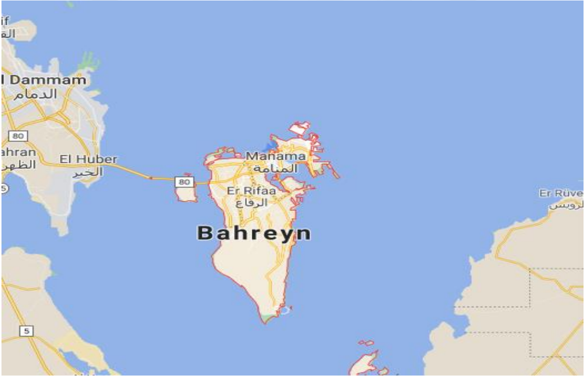
Şekil 6: Bahreyn Haritası