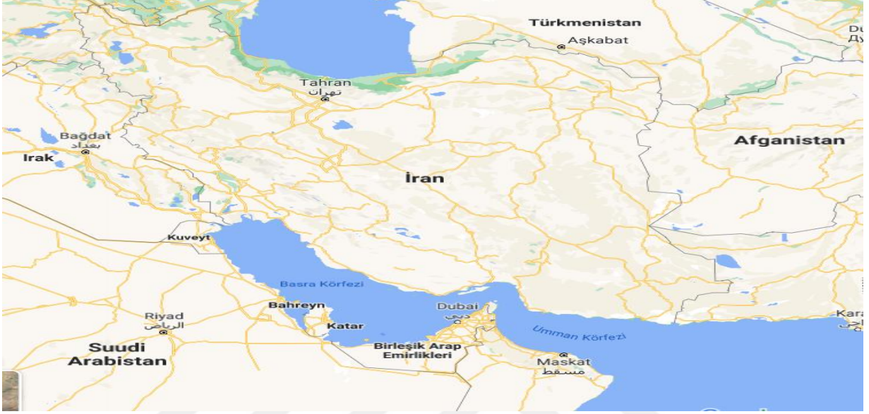
Şekil 2: İran Haritası