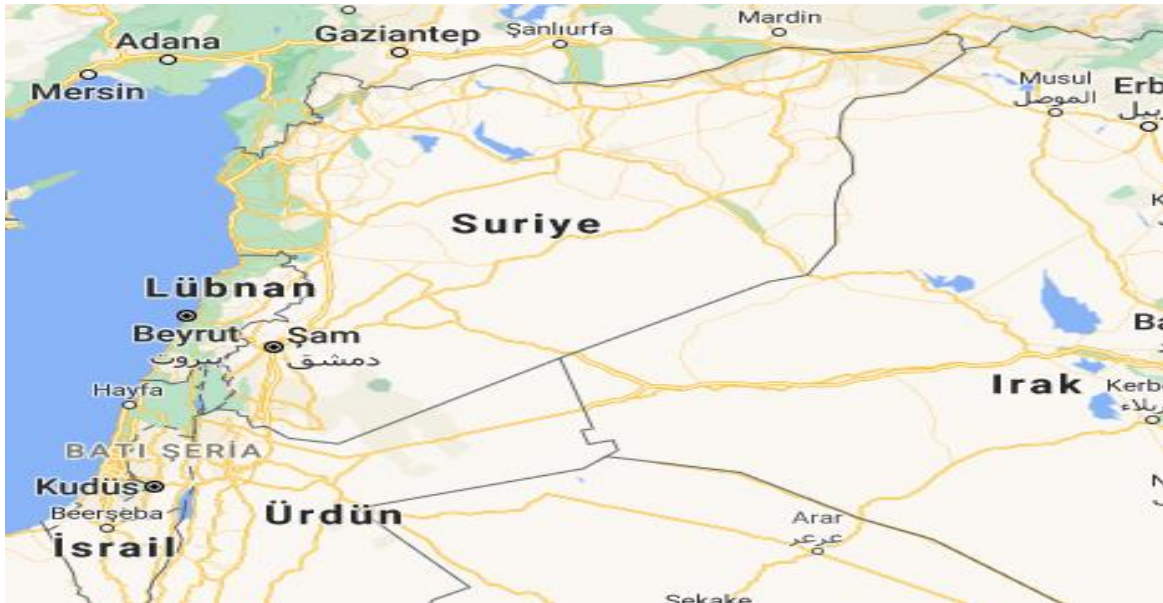
Şekil 7: Suriye Haritası