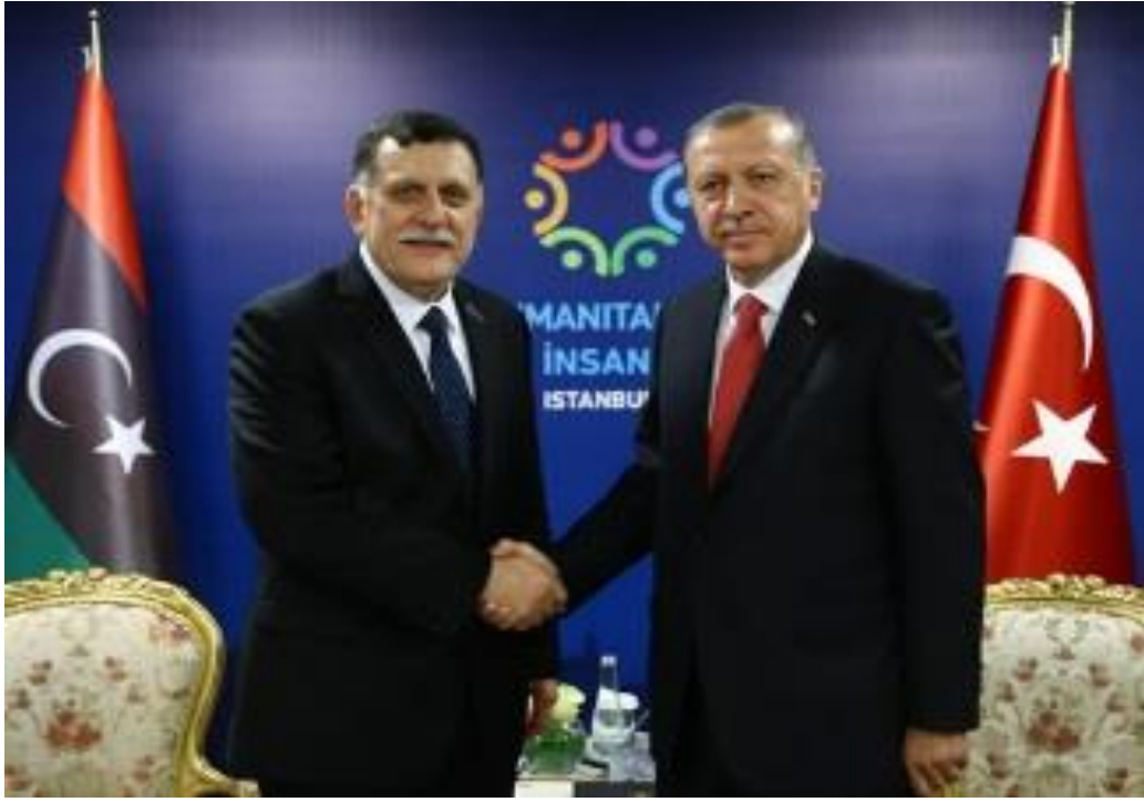
Resim 4.2: Türkiye Cumhurbaşkanı Recep Tayyip Erdoğan ile Libya Başkanlık Konseyi Başkanı Fayed Serraj'ın görüşmesi