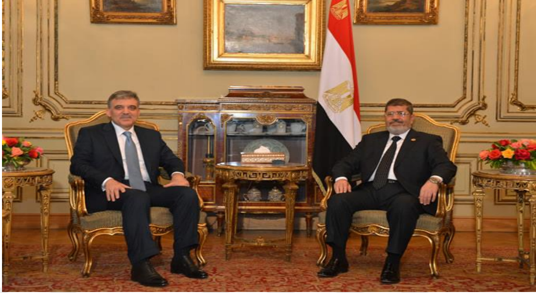
Resim 4.1: Türkiye Cumhurbaşkanı Abdullah Gül'ün Şubat-2013 tarihinde Mısır ziyareti