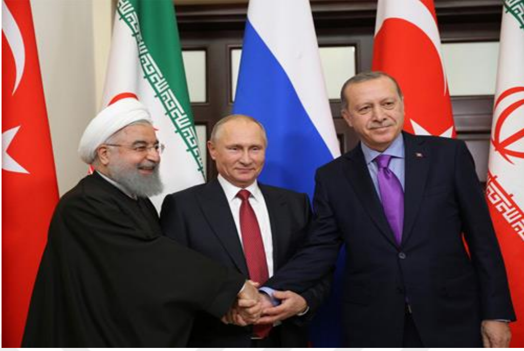
Resim 4.4: Suriye’deki durumu görüşmek üzere 22.11.2017’de Türkiye, Rusya ve İran’ın katıldığı üçlü zirve

Kaynak: https://www.tccb.gov.tr/haberler/410/87429/cumhurbaskani-erdogan-socide-uclu-suriye-zirvesine-katildi