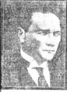
Büyük müncü Gazi Hz.

335 senesinin 15 mayısı... Türk milletinin tarihi... Bu asker... gazi idi. Bu asker... koca tarihler, bilerece kavgaların akbetinden sonra halıs için doğan bir azıdır. Bu aziz elinde yalın alevli meşaleyi Türkün sırtına şükürüne doğru kaldırınca Sa-karyalar doğdu. İbnleri is-tiklâl mücadelesine verdirdi. Tulumunun bir ta-rihiydi.