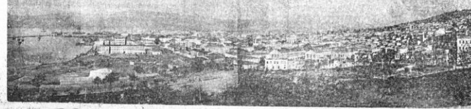
Güzel İzmirimizin umumî manzarası

Antalya mebusları Telgraf müdürlüğüne bir me - mure yazmışlar. Çünkü öyle bir hadise ki ehemmiyeti harikâlesini düşündükçe insanın bunn inanamayacağı geliyor. Tel - grafın okunması bilere bilere silah sesleri yükseldi. Değ - rüsü milletin bunda hak - ketti. İki saatları atan yine tel - graf müdürlüğü oldu. Havadis mecbur oldu ki bu haberi,