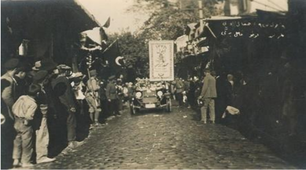
1927 yılı Kurtuluş Bayramı kutlamalarında kurtuluşu temsilen yapılan geçit töreni 409