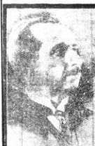
Bosyekilimiz İsmet Pa. Hz.

9 Eylül 38 Cumartesi... 6-9-38 tarihli tebliği... Ordu... Bursa istikametinde