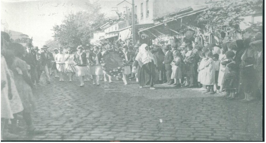
1927 yılında yapılan 9 Eylül geçit resmine ait bir fotoğraf.