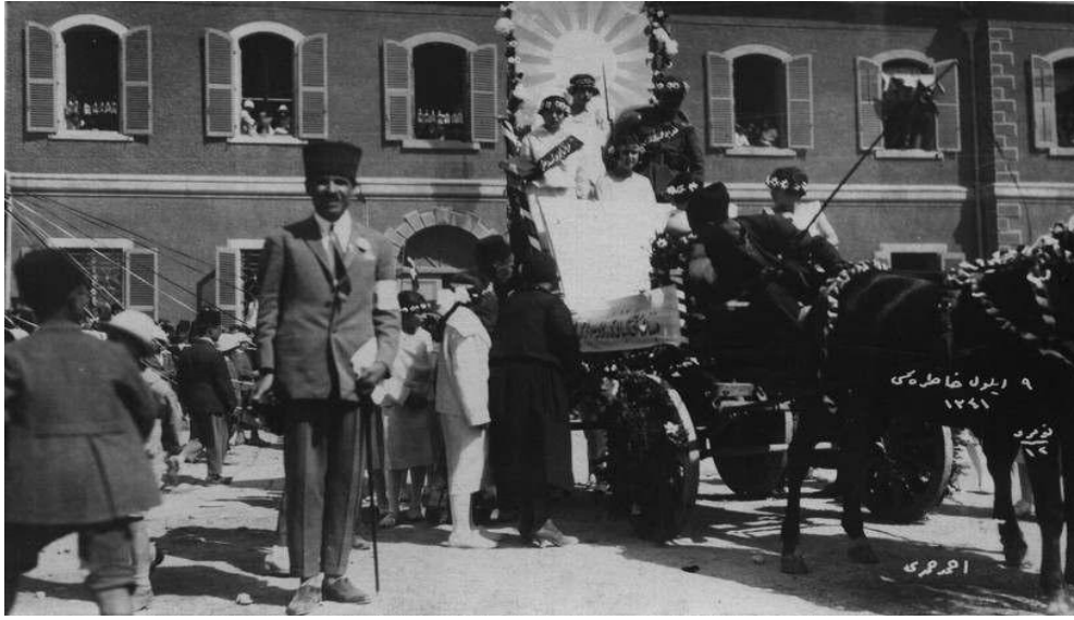
Basmane Garı önündeki 9 Eylül kutlamalarının görüntülediği fotoğraf 406 .