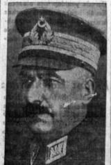
İzmir'i kurtarılanlardan Ferit Paşa Hazretleri

9 Eylül sabahı, o zamanlarda... kurtuluşu için... günün ilk saatlerinde... okullarında parıldadı... halkı şimşek gibi çığlıklar... kaldı. İzmir üyü senelik... bir anın bir kâğıdıdır, bir... bir gün evel kendi hayatını... namına kâhından ölümüne... yatın en son kâğıdını da... dünyaya bıraktı.