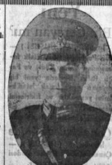
İzmir'i kurtarılanlardan İsmet Paşa Hazretleri

9 Eylül Sabahı 8-9-338 gece yarısından sonra... kurtuluşu için... günün ilk saatlerinde... okullarında parıldadı... halkı şimşek gibi çığlıklar... kaldı. İzmir üyü senelik... bir anın bir kâğıdıdır, bir... bir gün evel kendi hayatını... namına kâhından ölümüne... yatın en son kâğıdını da... dünyaya bıraktı.