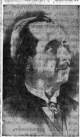
İzmir'i kurtarılanlardan İsmet Paşa Hazretleri

Türk milletinin bu büyük... kurtuluşu için... günün ilk saatlerinde... okullarında parıldadı... halkı şimşek gibi çığlıklar... kaldı. İzmir üyü senelik... bir anın bir kâğıdıdır, bir... bir gün evel kendi hayatını... namına kâhından ölümüne... yatın en son kâğıdını da... dünyaya bıraktı.