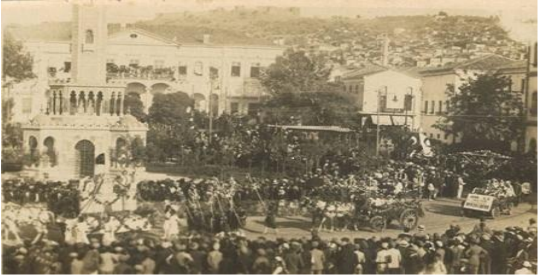
Konak Meydanı'nda 9 Eylül Kurtulus Bayramı kutlamalarının görüntülediği bir fotoğraf 408 .