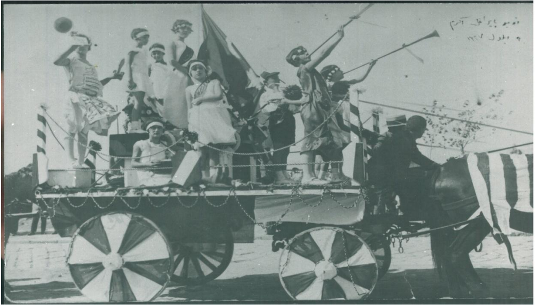
1927 yılında yapılan 9 Eylül geçit resmine katılan atlı arabaya binen, saçları çiçeklerle süslü genç kızlar.