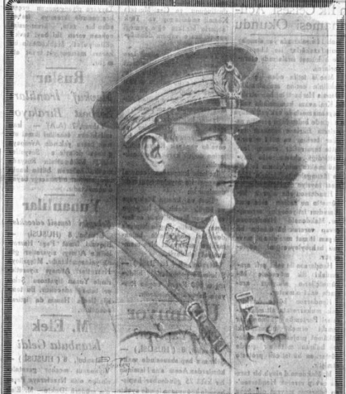
Türkün Halâskârı Gazi'si Mustafa Kemal Hazretleri