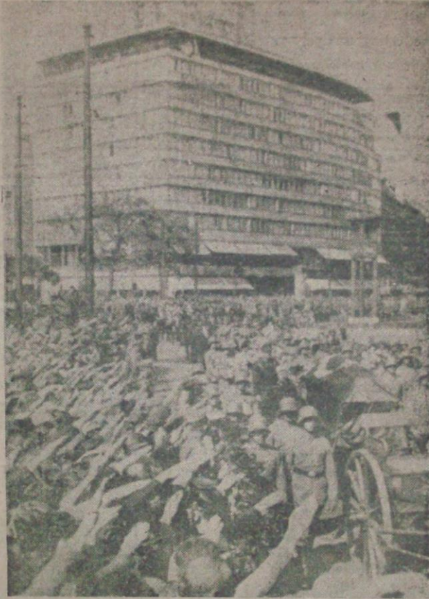
Kemalettin Sami Paşa'nın Berlinde cenaze merasimi.

giltere'nin bir hare- u ilan et- edilmekte- M. Say- eden bir