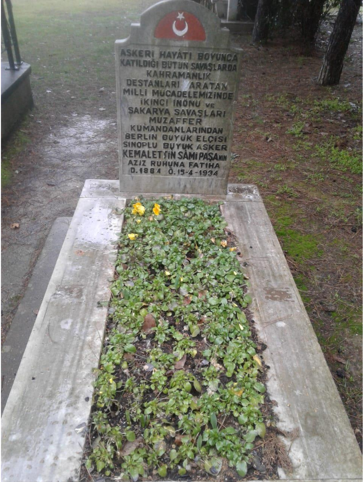
Ek-11. Kemalettin Sami Paşa'nın ilk defnedildiği 16 Mart Şehitliği'ndeki Mezarı