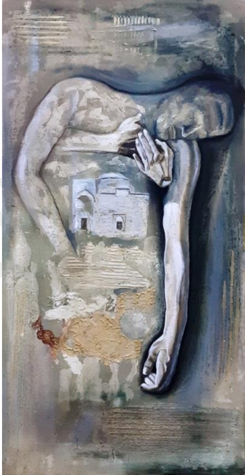
Resim 3.5.1. “Öz” isimli eser. 65x120cm (KÖYLÜ, 2019, Kırşehir)