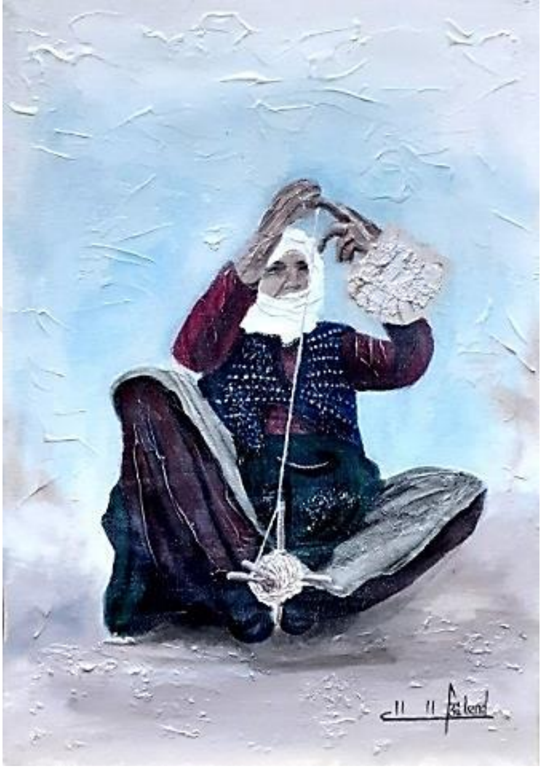
Resim 3.8.1. “Egiren” isimli eser. 35x50cm (KÖYLÜ, 2020, Kırşehir)