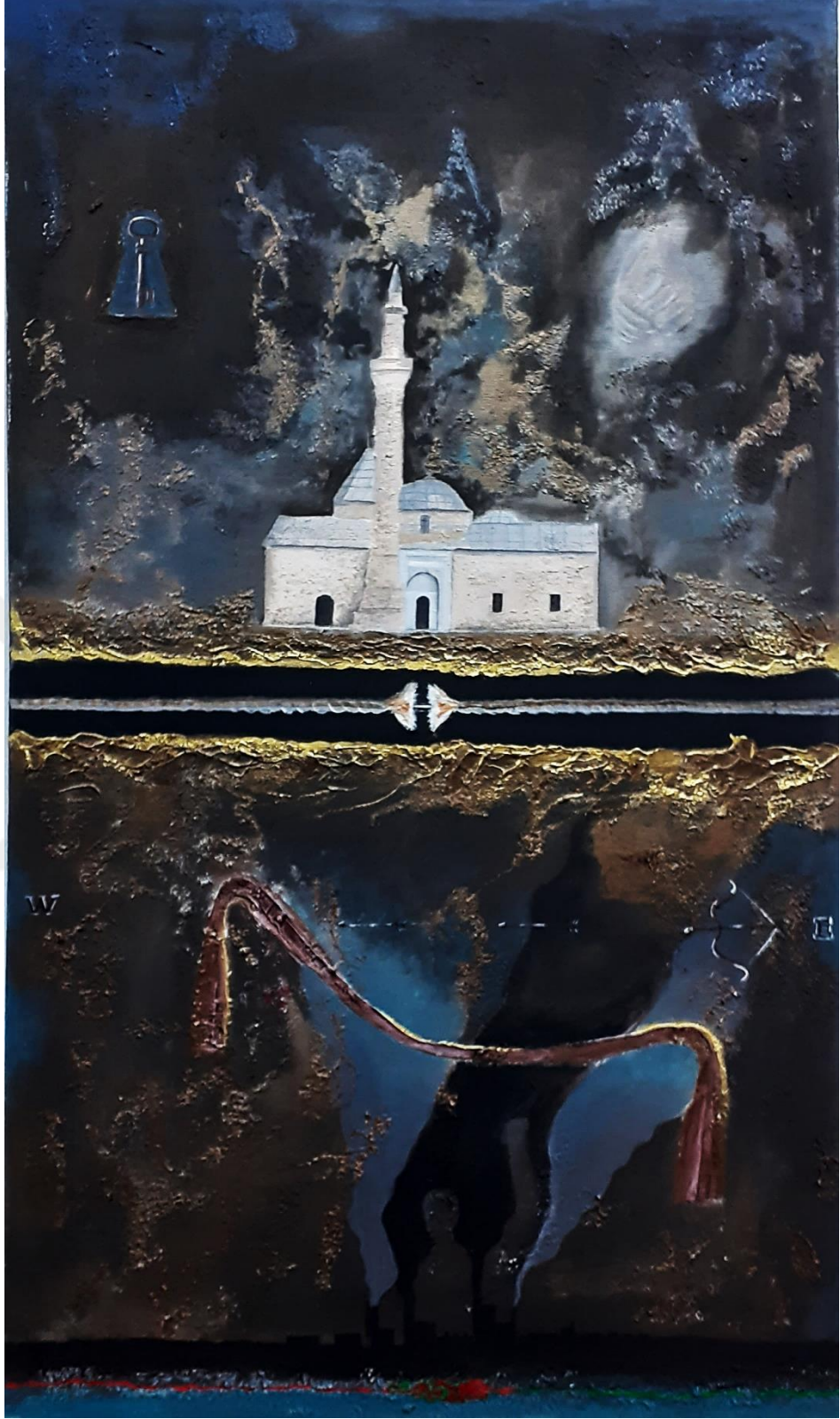
Resim 3.2.1 “Kuşatan” isimli eser. 71x121 (KÖYLÜ, 2020, Kırşehir)