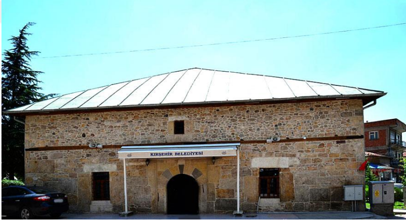
Resim 2.1.6. Çarşı Camii dış görünümü.( KÖYLÜ, 2019, Kırşehir)

gelince, yapı kareye yakın dikdörtgen bir plana sahiptir. Üstü içeriden ahşap kırkangıç tavanla, dışarıdan ise kurşun çatı ile örtülüdür. Yapının, kuzey yönüne sonradan eklenmiş olan camekanlı bölümden geçilerek giriş kapısına ulaşılmaktadır. Eser 1975 yılında Vakıflar Genel Müdürlüğü'nce onarılmıştır. Buna ek olarak yakın tarihlerde yapı restore edilmiştir. Günümüzde kuzey yönüne sonradan eklenmiş olan camekanlı bölüm kaldırılarak yapı orijinal haline kavuşturulmuştur. Giriş kapısı, dikdörtgen planlı, iç içe silmeler ortasında basık kemerli olarak düzenlenmiştir. Yapının, dışarıdan dikdörtgen şeklinde, içeriden ise yuvarlak kemerli, doğu ve batı yönlerinde üçer, kuzey ve güney yönlerinde ikişer adet pencereleri vardır. Sütunla mihrap arasında kalan kare mekan, ahşap sekizgen kırkangıç tavan ile örtülüdür. Üst üste bindirilen kirişlerden oluşan bu tavan tipiyle yapı sanat tarihi açısından önem taşımaktadır. Yapının sonradan konulan mihrap ve minberi vardır, minaresi bulunmamaktadır. Günümüzde ibadete açıktır(Acar,2018:22).