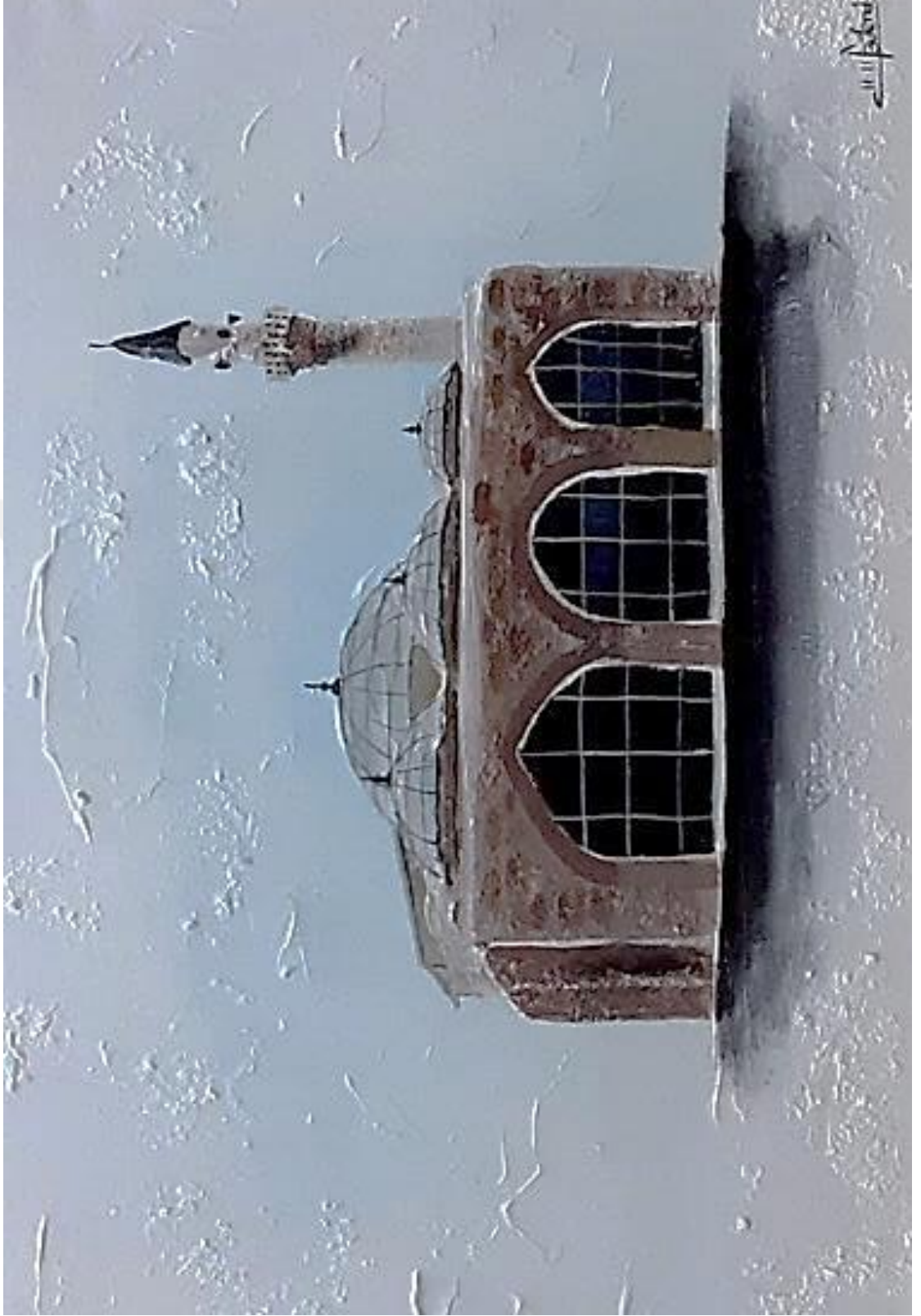
Resim 3.11.1. “Kapucu Camii” isimli eser. 50x35cm (KÖYLÜ, 2020, Kırşehir)