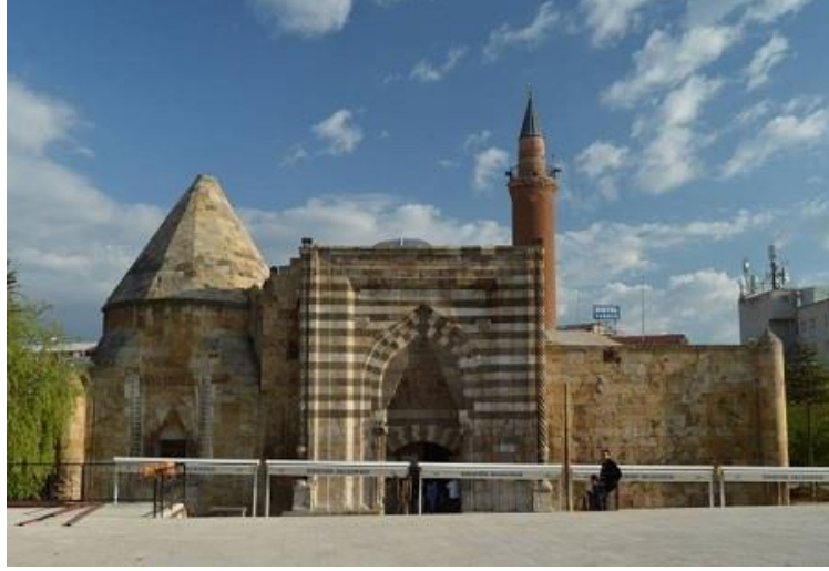
Resim 2.1.1. Cacabey Medresesi dış görünümü.( KÖYLÜ, 2018, Kırşehir)