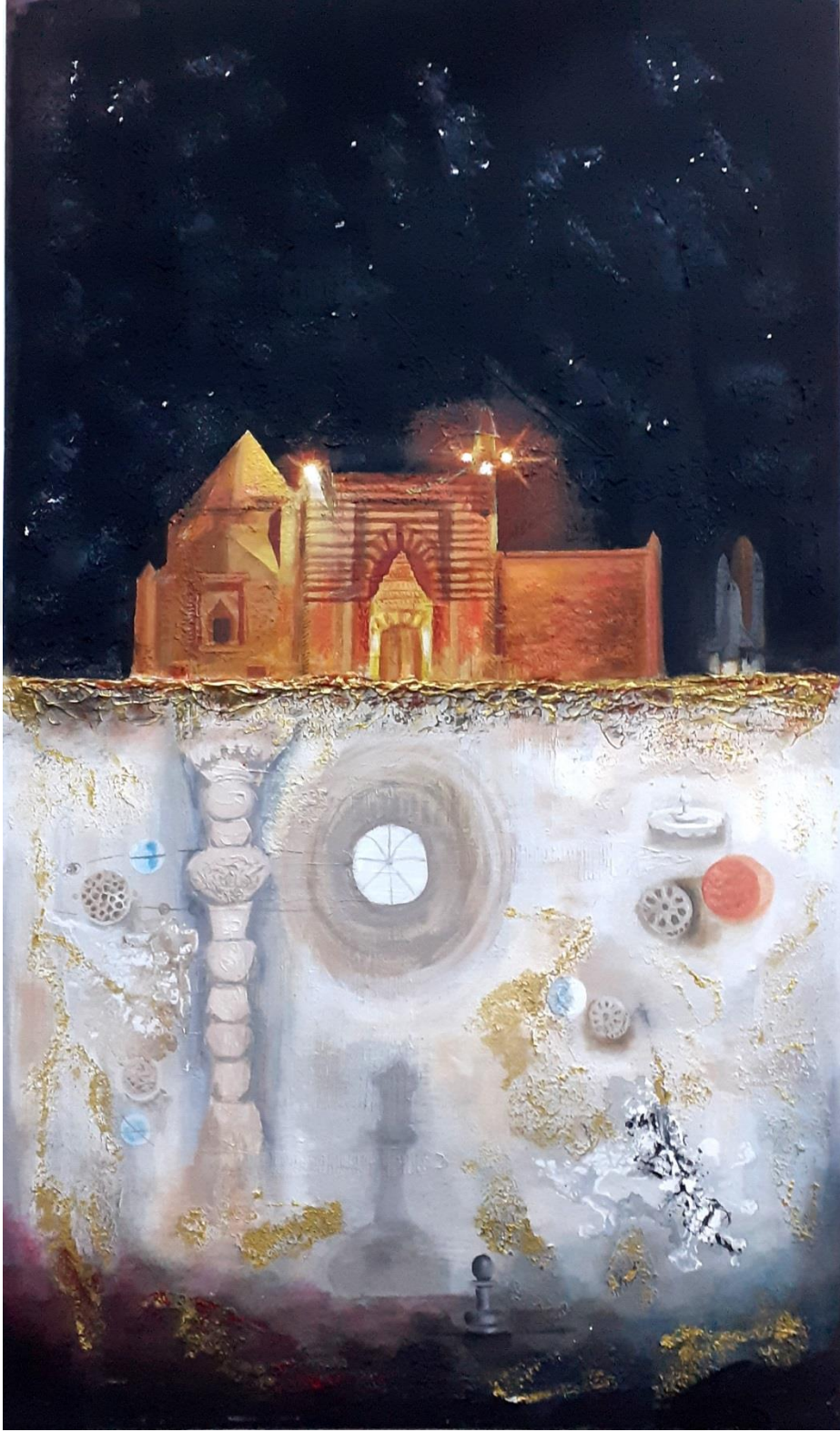
Resim 3.1.1. “Yükselen” isimli eser . 71x121cm (KÖYLÜ, 2020, Kırşehir)