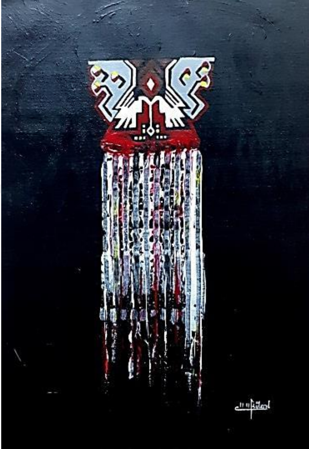
Resim 3.6.1. “Akış” isimli eser. 50x70cm (KÖYLÜ, 2020, Kırşehir)