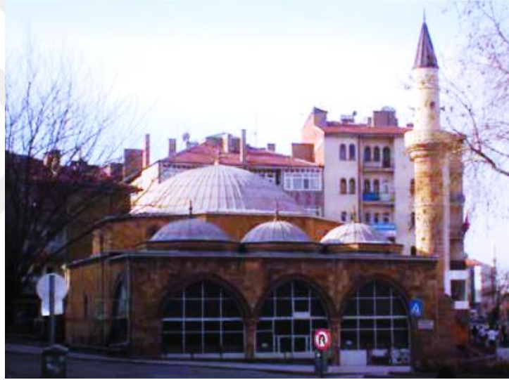
Resim 2.1.5. Kapucu Camii dış görünümü (KÖYLÜ, 2019, Kırşehir)

cemaat yerinden girilmektedir. Son cemaat bölümü üç yönden camekanla kapatılmıştır. Bu camekan yapısı itibariyle caminin orijinalliğini bozmuştur. Ayrıca, son cemaat bölümü ikiye ayrılarak tavanı ahşap malzeme ile düz bir şekilde örtülmüştür. İkinci katı kadınlar bölümü olarak düzenlenmiştir. Yapının giriş kapısına, yapının doğu yönüne yerleştirilen demir merdivenlerle ulaşılmaktadır. Yapının ana giriş kapısının iki yanında, birer niş ve nişlerin yanında da birer sivri kemerli pencere bulunmaktadır. Yapı birçok onarım geçirmiştir. İlk cami kubbeli iken, kubbesinin yıkılması nedeniyle, yuvarlak ahşap kirişleme üzerine kiremit kaplı ahşap çatı yapılmış daha sonra tekrar kubbeli olarak inşa edilmiştir. Mihrap, minber ve kadınlar mahfili yakın zamanda yapıldığı için sanat tarihi açısından bir önemi yoktur( Acar,2018:19).