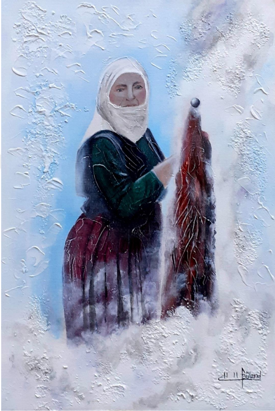
Resim 3.9.1. “Boyayan” isimli eser. 35x50cm (KÖYLÜ, 2020, Kirsehir)