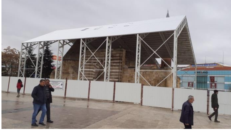
Resim 2.1.3. Cacabey Medresesi restorasyon çalışması. (KÖYLÜ, 2019, Kırşehir)