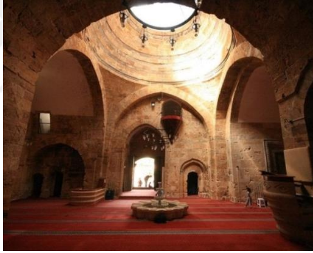
Resim 2.1.2. Cacabey Medresesi İç mekan görünümü. (KÖYLÜ, 2018, Kırşehir)