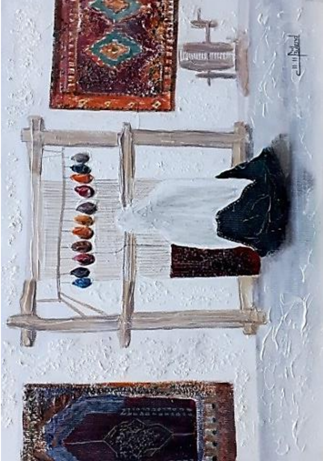
Resim 3.7.1. “Dokuyan” isimli eser. 50x35cm (KÖYLÜ, 2020, Kırşehir)