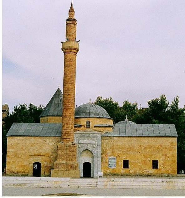
Resim 2.1.4. Ahi Evran Zaviyesi dış görünümü.( KÖYLÜ, 2019, Kırşehir)