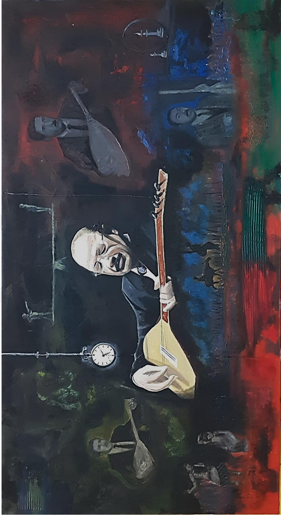
Resim 3.3.1. “Son Tezeneler” isimli eser. 101x184 cm (KÖYLÜ, 2019, Kırşehir)