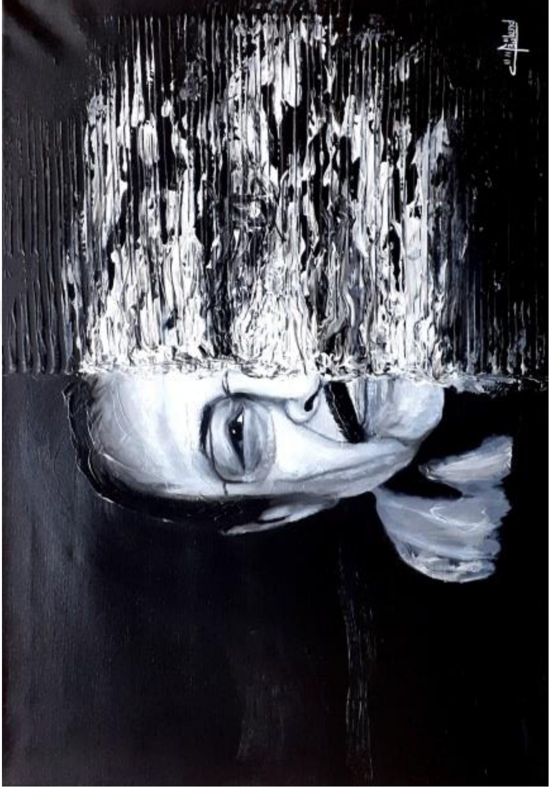
Resim 3.4.1. “Varoluş” isimli eser. 70x50cm (KÖYLÜ, 2020, Kırşehir)