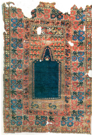
Görsel 4. Vakıflar Halı Müzesi'nde Bulunan E.65 Envanter Numaralı 19. yy'a Ait Gördes Seccadesi (Anonim, 1992a)

Gördes halılarının bazı örneklerinde zıt renklerin bir araya geldiği görülmektedir. Kırmızı ile lacivert, turuncu ile yeşil, turuncu ile lacivert genellikle yan yana kullanılmıştır. Şekil 4'de bu zıt renkler kullanılarak dokunmuş bir örnek yer almaktadır.