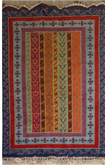
Görsel 17. Şal Deseni (Gördes Merkez-2014)