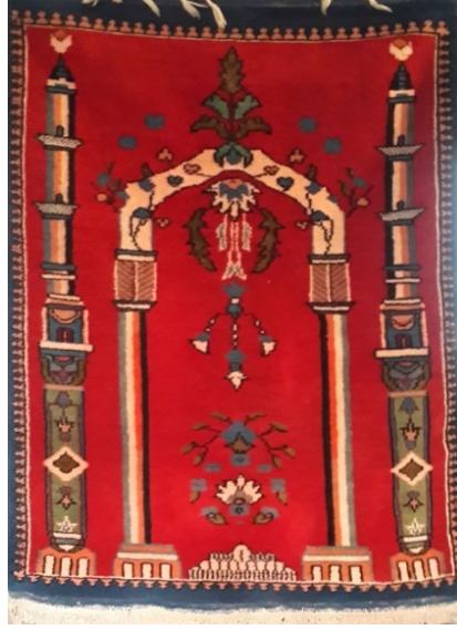
Görsel 15. Sütunlu (Marpuçlu) Gördes (Deliçoban Köyü-2014)

Bir başka değişim ise sütunlu (marpuçlu) Gördes halılarında görülmektedir. Bu halılarda eski Gördes halısı desenlerinden yola çıkılarak değişime uğramış ve farklı desenler tasarlanmış örnekler görülmektedir (Şekil 15).