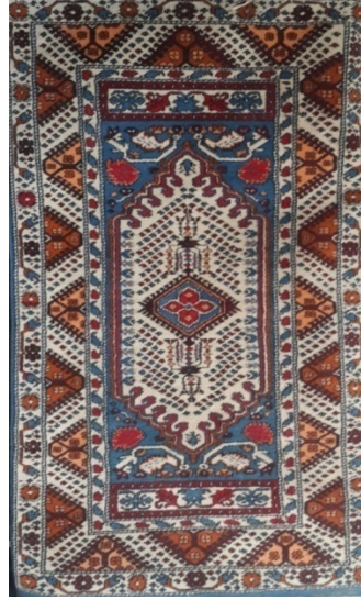
Görsel 12. Kız Gördes (Gördes-Merkez, Güneşli Mahallesi-2014)

Bitkisel boya ile elde edilen renkler pastel renk ve tonlarda olmakta, yapay boyalar ise parlak renkler vermektedir. Günümüzde kullanılan renklerin bir kısmı geleneksel renkler olmasına rağmen yapay boyaların kullanılması ile elde edilen renkler canlı oldukları için dokumada renklerin birbirleri arasındaki uyumu geleneksel halılarda olduğu gibi olmamaktadır. Ancak ticari amaçlı dokunan bu halılar, tüketici tarafından tercih edilmektedir. Tüketici tercihlerinin bu yönde olması da geleneksel renklerdeki değişimin hızlanmasının önemli bir nedenidir. Şekil 12'de son yıllarda dokunmuş bir Kız Gördes halısı ve kullanılan renkler görülmektedir. Dokumada beyaz ve kahverengi ile beraber turuncu, kırmızı ve mavinin canlı tonları yer almaktadır.