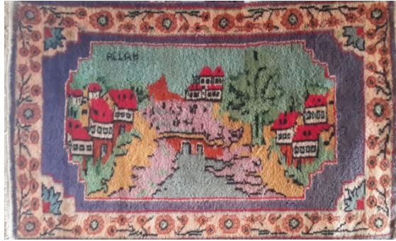
Görsel 14. Manzaralı Gördes (Deliçoban Köyü-2014)

Bir başka değişim de geleneksel Manzaralı Gördes halılarında görülmektedir. Geleneksel örneklerinde, manzara motifi olarak camii veya bahçeli evler bordürde yer alırken, günümüzde bu motifler zeminde yer almakta olup bordür de ise stilize çiçek motifleri görülmektedir (Şekil 14).