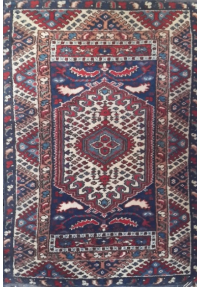
Görsel 13. Kız Gördes (Deliçoban Köyü-2014)

Günümüzde yörede, geleneksel Gördes halılarından daha çok Sinekli Gördes adı verilen halıların dokunmasına devam edilmektedir. Bu halılarda dm^2 lerinde ki düğüm sayısında değişim sebebiyle, motiflerde sadeleşme görülmektedir. Sinekli Gördes ya da Kız Gördes adı ile bilinen bu halıların eski örneklerinde sinek motifleri daha yoğunken günümüz örneklerinde bu motiflerinin azaldığı tespit edilmiştir (Şekil 13).