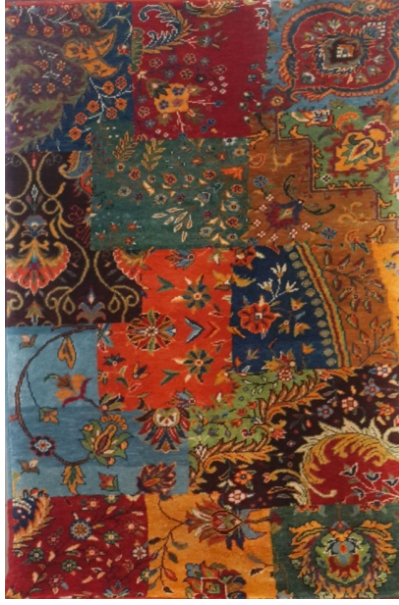
Görsel 16. Kirkyama Deseni (Gördes Merkez-2014)