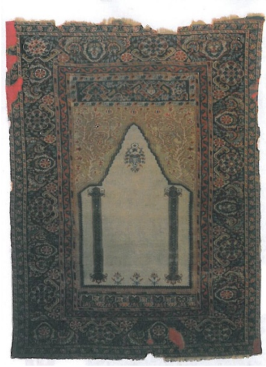
Görsel 10. Türk İslam Eserleri Müzesi'nde Bulunan TİEM 806 Envanter Numaralı 19. yy'a ait Marpuçlu (Sütunlu) Gördes Halısı (Anonim2009)

Elmalı Gördes: Ana bordürlerinde üç ayrı yöne bakan ve bir dalla birbirine bağlı bitkisel karakterli motif taşıyan namazlıklara verilen isimdir (Öztürk ve Aydın, 1994:30) (Şekil 11).