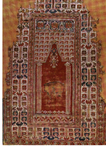
Görsel 8. Türk İslam Eserleri Müzesi’nde Bulunan 17. yy’a ait Avizeli Gördes Halısı (Anonim, 1992a)

Gördes” denir (Şekil 8). Kandilli Gördes halılarında kandilin yer almadığı ve mihrap zeminin düz renk olarak dokunduğu örneklere ise “Mihraplı Gördes” denir (Bayraktaroğlu, 1999:60; Bozkurt, 1997:259; Deniz, 2000:108; Leloğlu-Ünal, 1999:531) (Şekil 9).