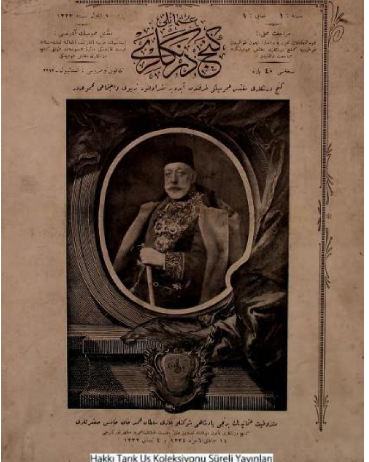
Osmanlı Genç Derneği Mecmuası, S. 1.