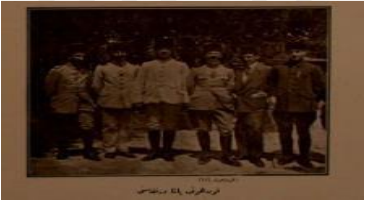
Osmanlı Genç Dernekleri Mecmuası, S. 5, s. 2.