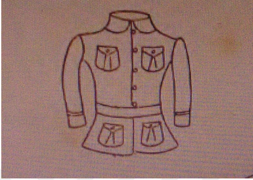
Osmanlı Genç Derneđi Mecmuası, S. 16, s. 23.