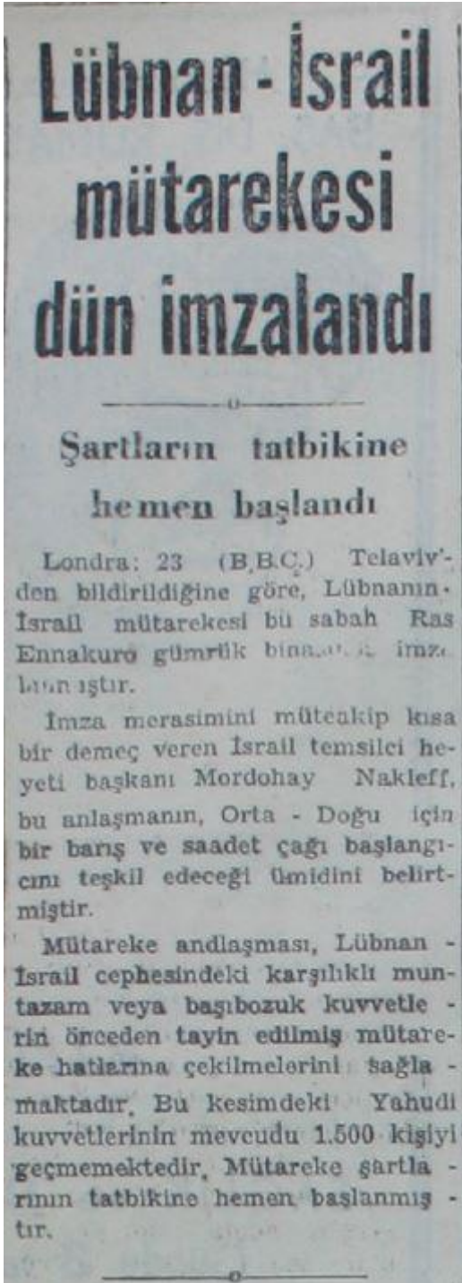
EK 8. Yeni Sabah gazetesinin "Lübnan-İsrail mütarekesi dün imzalandı" başlıklı haberi. 24.03.1949.