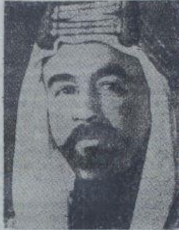
Arap orduları Başkomutanı Kıral Abdullah

Kudüste, İngiliz valisinin hareketinden bir saat sonra mütareke bozulmuş ve şiddetli bir muharebe başlamıştır. Yahudiler Rus kilisesi yanında stratejik bir mevki ele geçtiklerini iddia ediyorlar. Kudüs - Telâviv yolunda Babüvass'da şiddetli çarpışmalar devam ediyor. Beytüllâhîm civarında beş Yahudi müstameresi Araplar tarafından zapt edilmiştir. Akkâ'da da şiddetli savaşlar yapılmaktadır. Yahudiler Akkâ'ya girdiklerini bildiriyorlar.