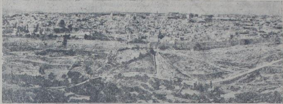
Kudüs şehrinin umumî manzarası

Londra 28 (Hususi) — Kudüs- te vaziyet gittikçe fenalaşiyor. Araplarla yahudiler arasında kanlı müsademeler devam ediyor. Mak- tullerin adedi gittikçe artıyor.