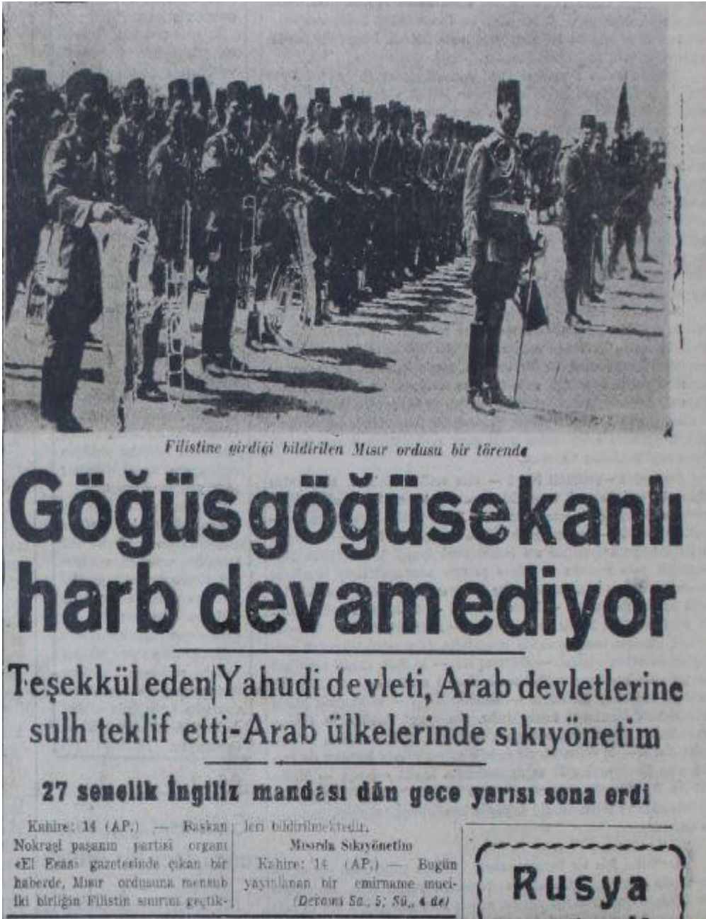
EK 5. Yeni Sabah gazetesinin Arap Orduları'nın Filistin'e girmesi ve Araplarla Yahudiler arasında devam eden savaş ile ilgili olarak "Gögüs göğüsekanlı harb devam ediyor" haberi. 15.05.1948.