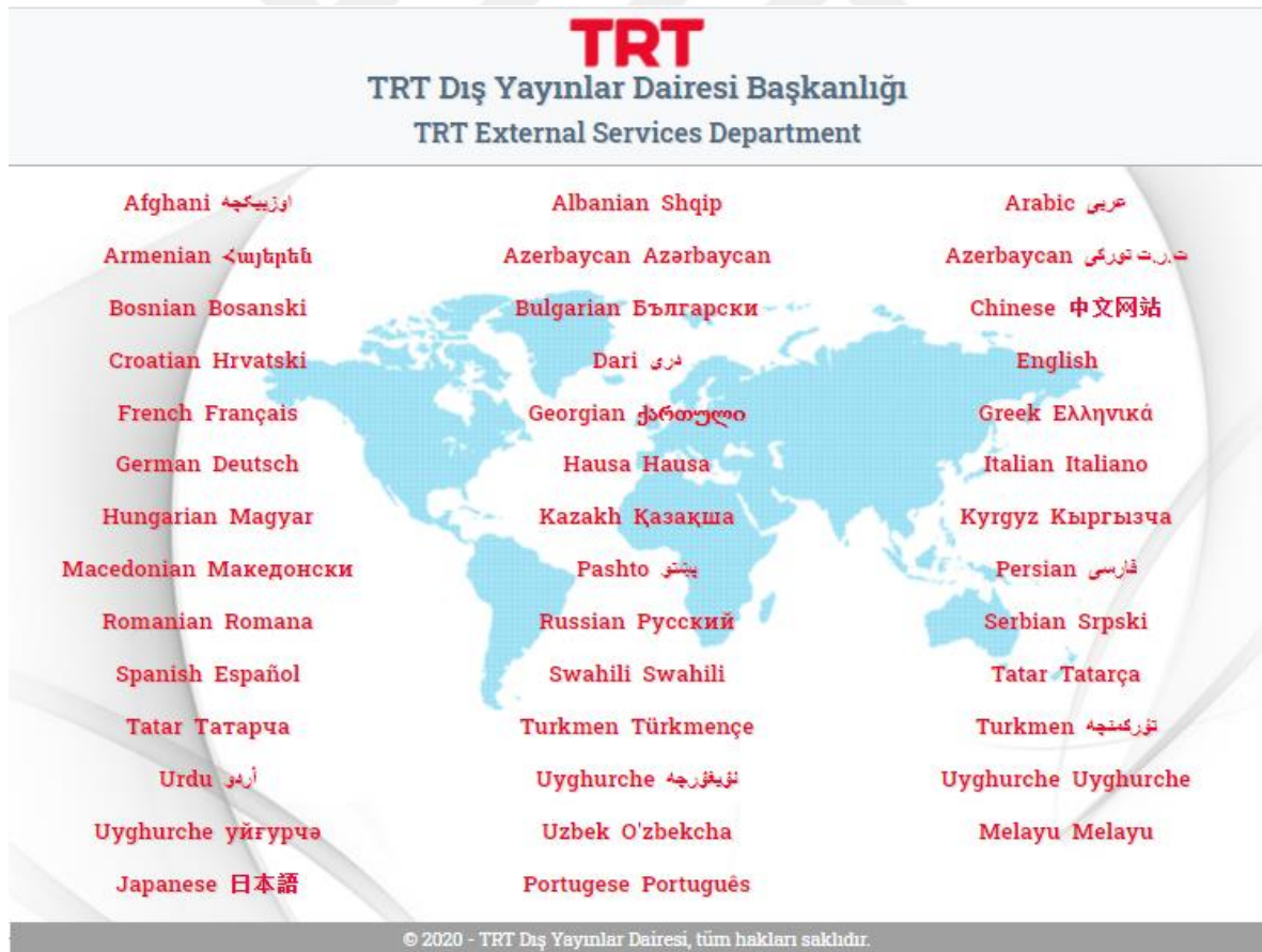
Tablo 6: TRT Yayın Dilleri

Kaynak http://www.trtvotworld.com/ (Erişim Tarihi: 22.12.2020)