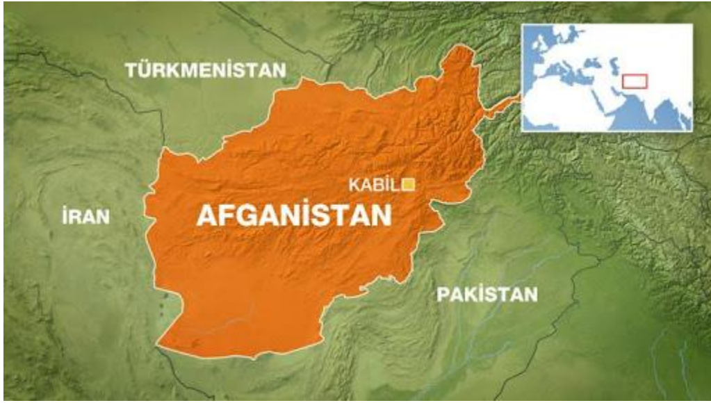
Harita.2.3.1. Afganistan'ının coğrafi konumu ve komşuları

Afganistan'ın yüzölçümü 453.100 km 2 olup, batıdan doğuya kadar 1451 km mesafe ve kuzey ile güney arasındaki mesafe ise 900 km olmasına göre, yüzölçümü bakımından dünyanın 41. ülkesidir.