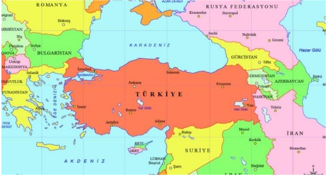
Harita 2.1. Türkiye’nin coğrafi konumu ve komşuları

Türkiye coğrafyası, 25° – 44° doğu meridyenleri ile 34° – 41° kuzey paraleller arasında, ekvatorun kuzeyinde, başlangıç meridyenin doğusunda ve orta kuşakta kalan Avrupa ve Asya’yı bağlayan bir ülkedir. Coğrafi konum itibari ile Asya ve Avrupa arasında ve doğu-batı kesişimde yer alan Türkiye’nin kuzeydoğusunda Gürcistan, kuzey batısında Bulgaristan, batısında Yunanistan, doğusunda Ermenistan, Azerbaycan ve İran, güney doğusunda ise Suriye ve Irak bulunmaktadır (Wikipedia, 2021a), (Harita 1).