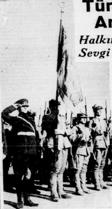
Hatayın kavuştuğu Türk askerlerinden bir grup

T ürk ordusunun hiç bir tecavüz eneline âlet olmadığı, ancak öz yurdun varlığını ve memleketin hâllerini koruduğu ve daima sulh ve intizama hizmet ettiği, nihayet Fransızlar tarafından (Arkas: Sayfa 18, sütun 4 sa)