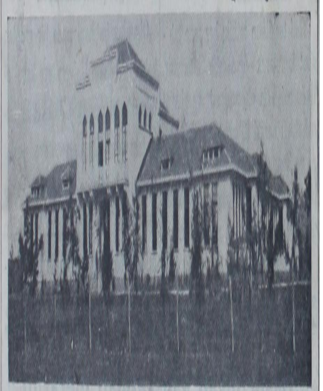
Resim 4. Antakya'da cumhuriyet bayramı kutladıkları gerekçesiyle kapatılan Türk Kız Lisesi