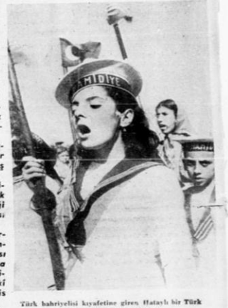
Türk bahriyelisi kıyafetine giren Hataylı bir Türk kız istiklal marşını söylüyor.

Türk askerlerinin Fransız askerleriyle iş birliği yapması ve Türk - Fransız dostluk muahedesi imzalanması bütün dünyada, ve bilhassa Yugoslavya ile Yunanistan'da, çok büyük memnuniyet uyandırmıştır. Bu anlaşmanın Şarki Akdenizde sulhu kafi bir şekilde tesis edeceği muhakkak sayılmaktadır. [Yazısı 10 uncu sayfada]