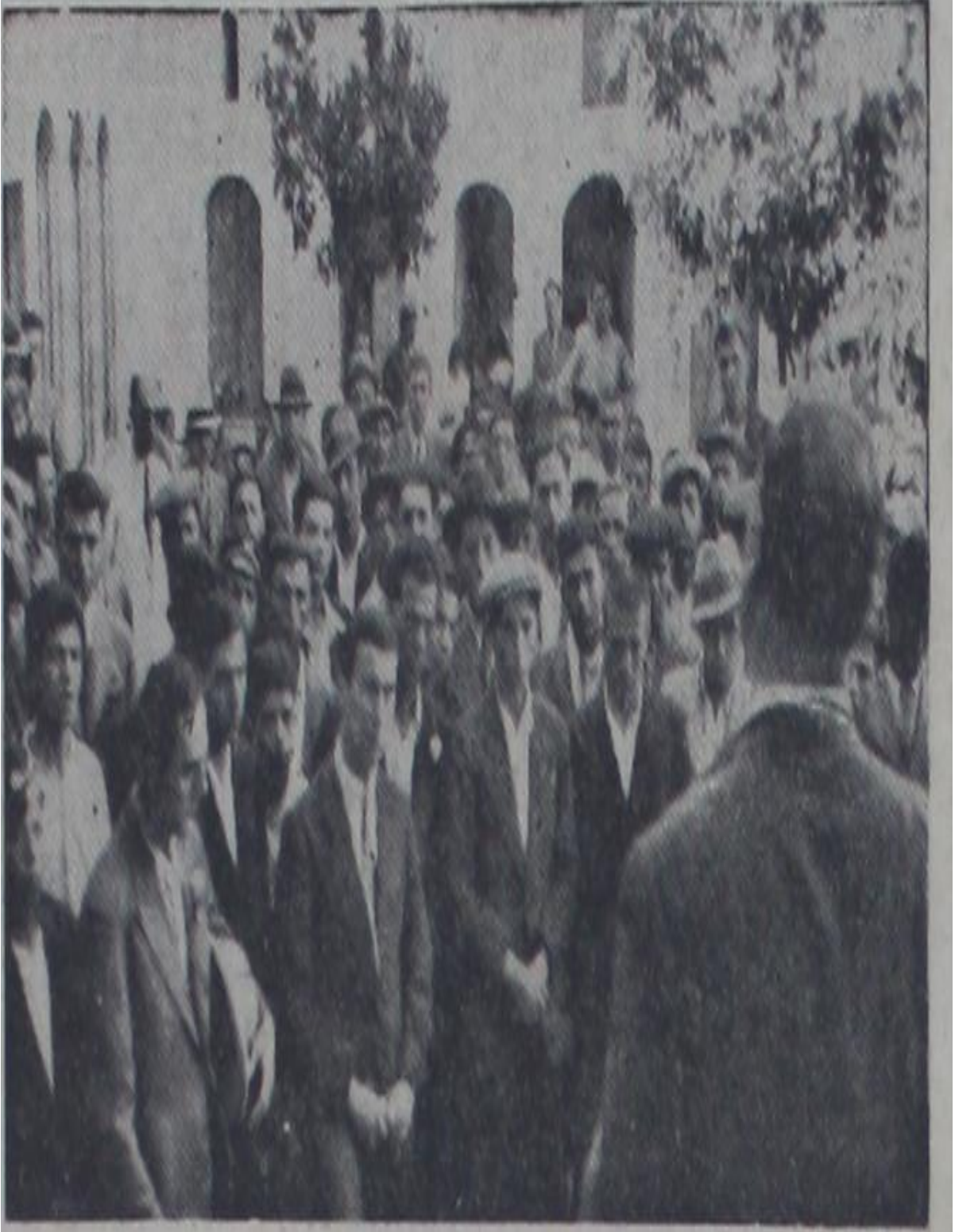
Resim 6. Köylere Yeni Türk Harflerini öğretmek için giden gençler