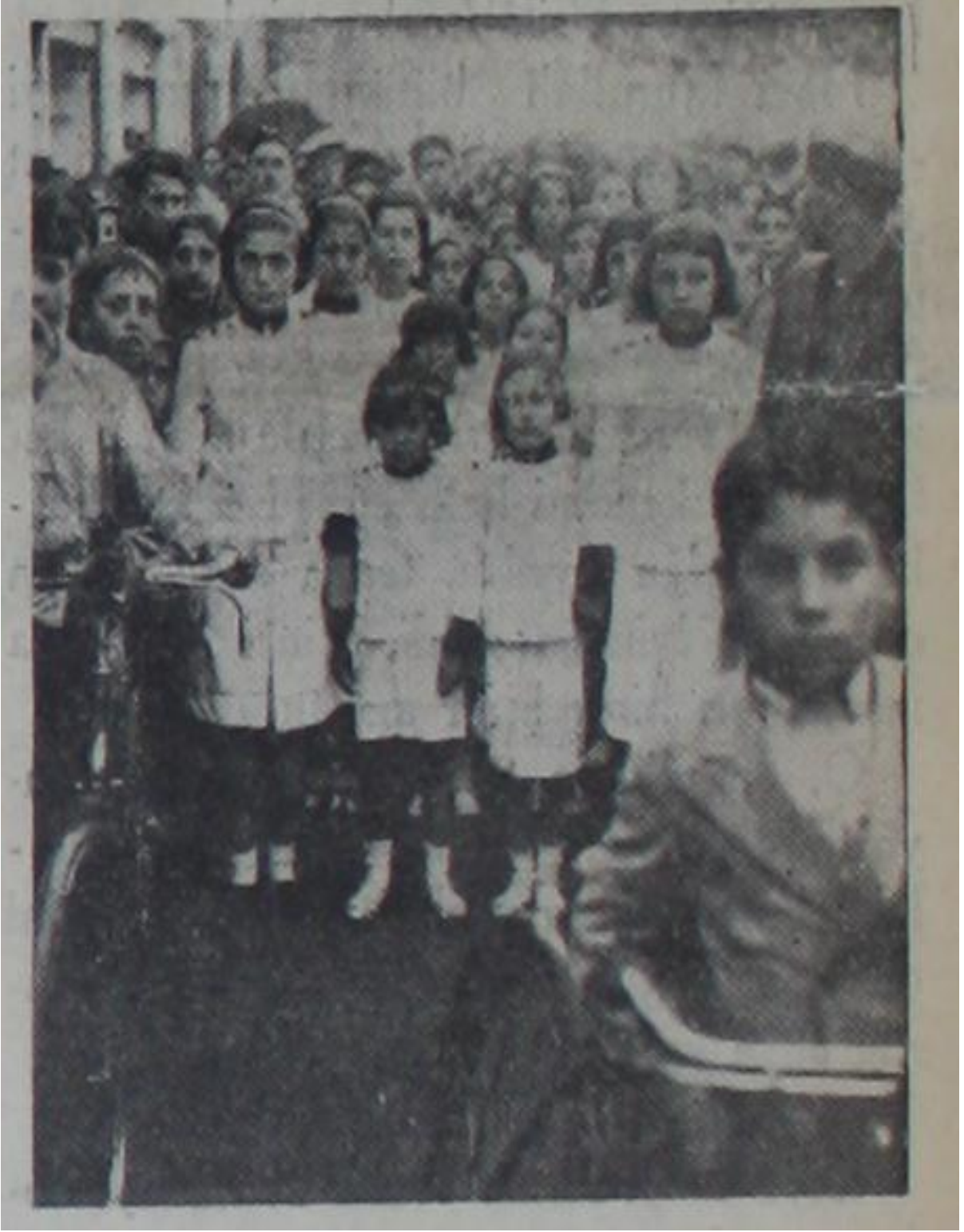
Resim 5. 1937 yılı Cumhuriyet bayramı için Antakya sokaklarında tezahürat atan kızlar