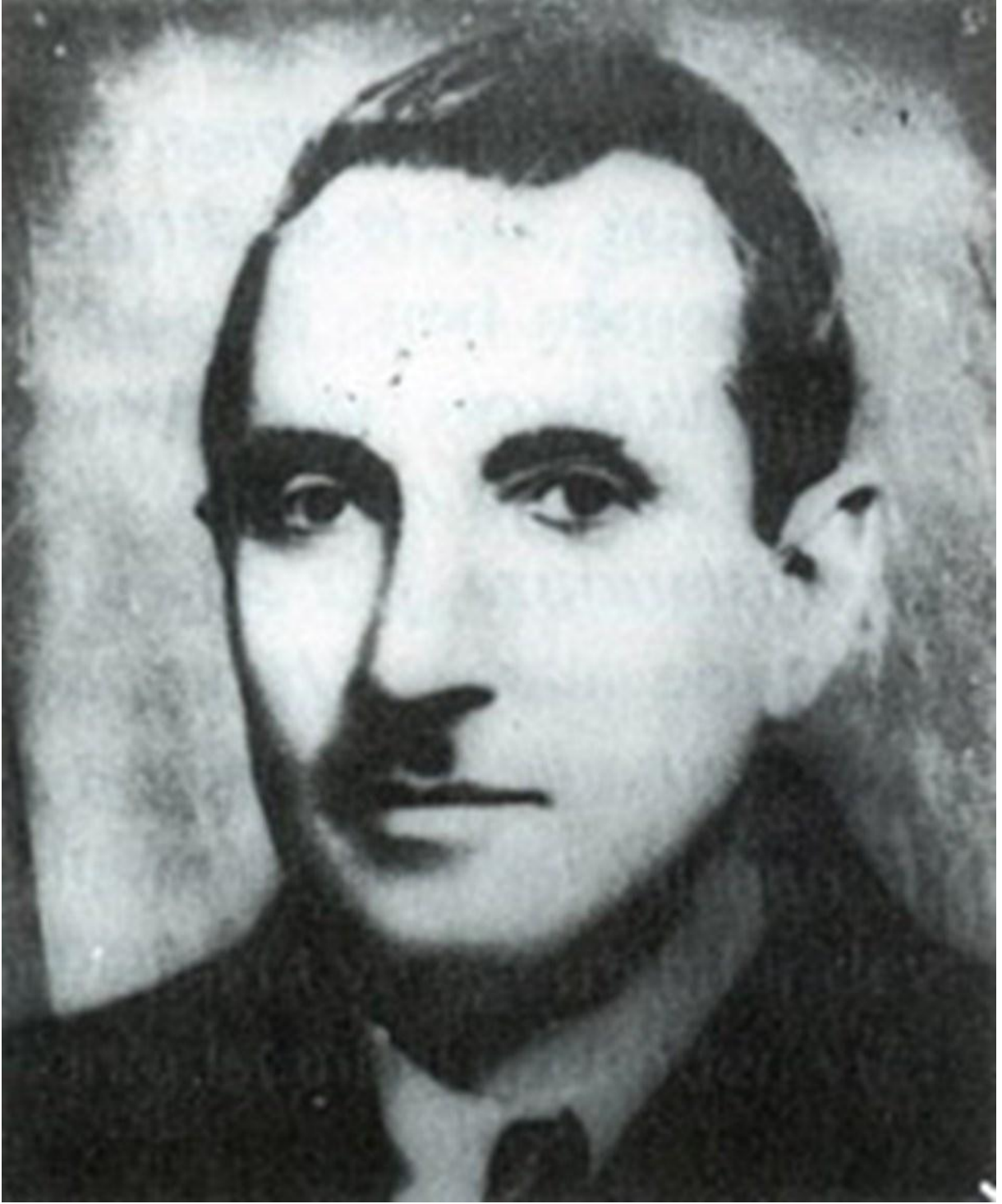
Resim 1. Hatay Devleti Cumhurbaşkanı Tayfur Sökmen