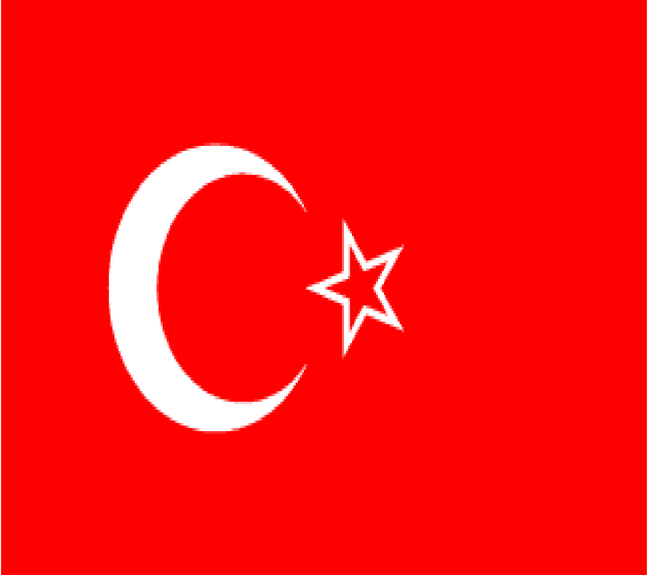
Resim 2. Hatay Devleti Bayrağı