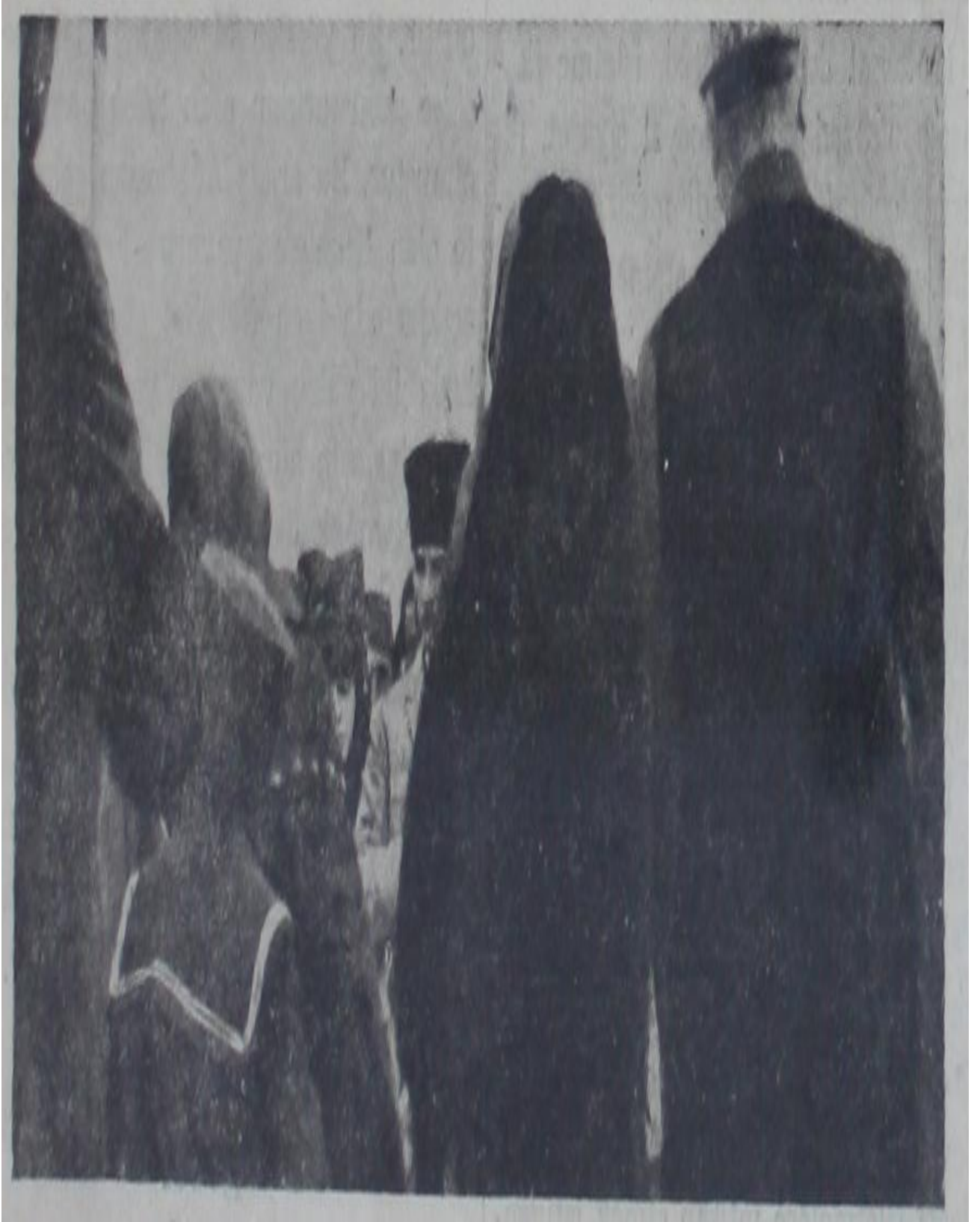
Resim 3. Atatürk'ün Adana gezisi esnasında siyah giyinmiş kızla olan fotoğrafı