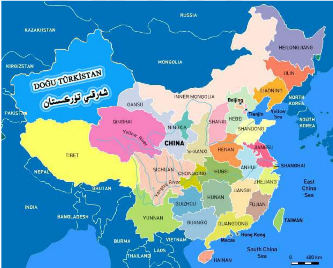
Harita 3: Doğu Türkistan Cumhuriyeti

Böylece gördüğümüz gibi Uygur Türkleri, geçmişte kurdukları Uygur Kağanlığı ve bağımsız Uygur Cumhuriyet'i gibi statüleri kaybederek, günümüzde var olan “Azınlık Topluluğu” durumuna düşmüşlerdir.