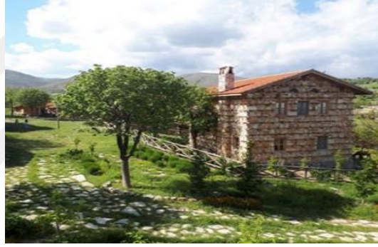
Şekil 4.67. Düğmeli ev tipi

Yaşayan Köy Anadolu kültürünü sunmak amacıyla tasarlanmıştır. Müzede Anadolu'nun yedi bölgesinden 17. ve 20. yüzyıl dönemlerine ait konut mimarisi sergilenmektedir. Akdeniz Bölgesi konut mimarisini temsilen “Düğmeli Ev”, Karadeniz Bölgesi'ni temsilen “Gözdolma Ev”, İç Anadolu Bölgesi'ni temsilen “Ankara Evi” ve Güneydoğu Anadolu Bölgesi'ni temsilen “Kerpiç Ev” yer almaktadır (Şekil 4.67, 4.68, 4.69 ve 4.70).