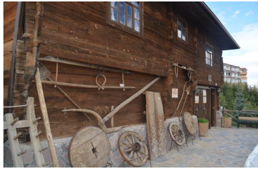
Şekil 4.17. Köy müzesi (Altınbaş, 2020)

Çocuk Etkinlik Evi'nde günümüzde pek çok çocuğun bilmediği, oynamadığı unutulmaya yüz tutmuş çocuk oyunları hayat bulmaktadır. Karagöz-Hacivat gibi gölge oyunu da belli zamanlarda oynatılmaktadır. Bu atölyede, az bir ücret karşılığında tahtadan yapılmış çeşitli oyuncakların çocuklar tarafından boyandığı etkinlikler düzenlenmekte ve çocukların eğlenebileceği ve beraberinde deneyim kazanabileceği ortamlar