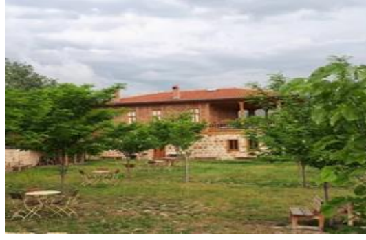
Şekil 4.69. Ankara bağ evi tipi