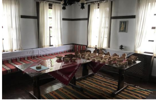
Şekil 4.37. El sanatları odası