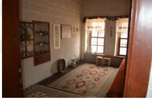
Şekil 4.26. Halk Hekimliği ve İnanışları Odası (Altınbaş, 2020)

Halk Hekimliği ve İnanışları Odası'nda şifalı bitkiler hakkında bilgi verilmektedir. Bununla beraber bu odada, zamanında el almış/ocaklı kişiler tarafından uygulanan kurşun dökme işlemi de canlandırılmaktadır. Bugün müzede kurşun dökme işlemini Türk Halk Bilimi konusunda eğitim gören ve müzede görevli olan öğrenciler gerçekleştirmektedir. İsteyen ziyaretçiler ücret karşılığında nazara karşı kurşun dökme deneyimini yaşamaktadırlar (Şekil 4.26).