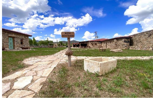
Şekil 4.63. Köy meydanı

Köy Meydanı, bir köyün sosyal yaşam alanıdır. Müzede yer alan köy meydanı bu kültürü yaşatmak amacıyla kurulmuştur (Şekil 4.63).