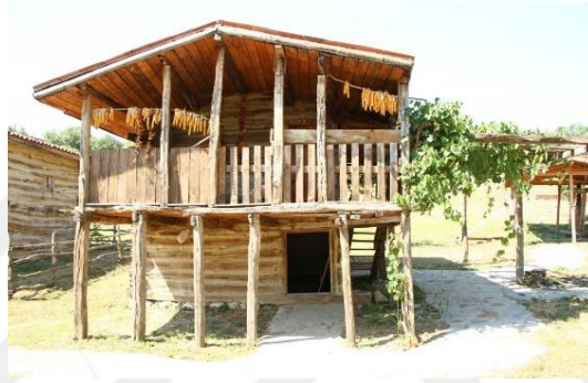
Şekil 4.87. Köy evi ( https://www.bursamuze.com/arkeopark-acik-hava-muzesi-513/ - Erişim Tarihi: 11-02-2021).

Bu geleneksel köy müzenin ilgi odağıdır. Ziyaretçinin geçmiş ile bugün arasında bir bağ kurmasını sağlamak amacıyla inşa edilen bu geleneksel köyde, evlerin yanı sıra; Köy Kahvesi, Ahır, Odunluk, Su Değirmeni, Çeşme, Ekmek Fırını, Ambar, Demirci Atölyesi, Pekmezlik, Gelin Odası, Dokuma Odası ve Mutfak gibi bölümler yer almaktadır (Şekil 4.87, 4.88, 4.89, 4.90, 4.91) ( https://www.bursamuze.com/arkeopark-acik-hava-muzesi-513/ - Erişim Tarihi: 11-02-2021).