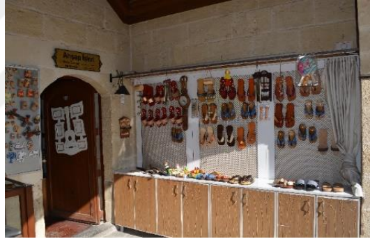
Şekil 4.48. Ahşap atölyesi (Altınbaş, 2020)

Müzenin üst katında yer alan odalardan biri Ahşap İşleri Odasıdır. Ahşap işleri odasında ahşap oymacılığı hakkında bilgi verilmekte ve hediyelik eşyalar satılmaktadır (Şekil 4.48). Diğer oda olan Hattat Odası'nda; hat yapımı izlenmekte ve bilgi alınmaktadır. Ayrıca bu odada üretilen eserler satışa sunulmaktadır (Şekil 4.49).