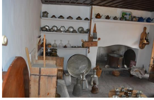
Şekil 4.3. Mutfak odası (Altınbaş, 2020)

Müzenin giriş katında yer alan hayat kısmında, Mahzen Odası bulunmaktadır. Bu oda gıdaların korunması için soğuk hava deposu olarak kullanılmıştır. Ayrıca, konakta olası bir yangın tehlikesine karşı değerli eşyalar da bu odada saklanmaktadır. Kışlık mutfak odasında yakın zamana kadar kullanılan mutfak kapları sergilenmektedir (Şekil 4.4).