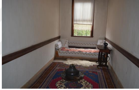
Şekil 4.7. Eyvan odası (Altınbaş, 2020)

Müzenin birinci katı “çardak” olarak adlandırılmaktadır. Burası geleneksel konak yaşamında aile büyüklerinin vakit geçirdiği “eyvan” bölümüdür (Şekil 4.7).