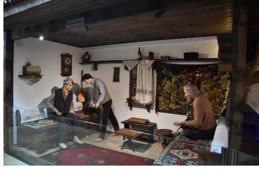
Şekil 4.85. Misafir odası

Cumhuriyet Odası bölümü, Ulu Önder Mustafa Kemal Atatürk ve İstanbul Heyetinin ilk resmi görüşmesi olan Bilecik Mülakatı'na ithafen kurulmuştur (Şekil 4.86).