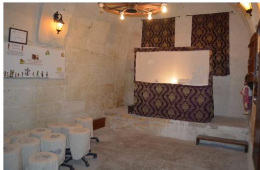
Şekil 4.22. Karagöz-Hacivat odası (Altınbaş, 2020)

Müzenin giriş katında Karagöz Odası yer almaktadır ve bu odada ziyaretçiler Karagöz ve Hacivat’ın hikâyesini dinleyip bir gölge oyunu seyretmektedirler. Karagöz Odası’nda zaman zaman isteyen ziyaretçiler de “Hayali” yerine geçip, kendilerine de bir yardımcı (yardak) belirleyerek, perde arkasından kuklalarla bir oyun sergileyebilmektedirler (Şekil 4.22).