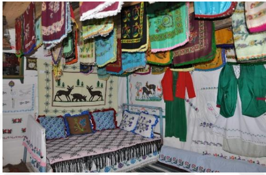
Şekil 4.90. Gelin Odası( https://www.bursamuze.com/arkeopark-acik-hava-muzesi-513/ - Erişim Tarihi: 11-02-2021).