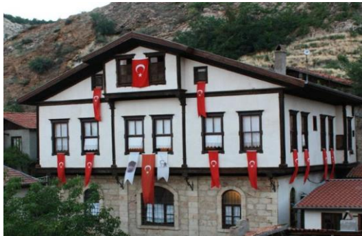
Şekil 4.1. Beypazarı yaşayan müze