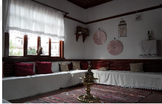
Şekil 4.77. Masal odası (Müze arşivi, 2020)

Masal Odasında, "Limon Kız", "Nohut Oğlan", "İmdi Dede", "Keloğlan", "Tuz Masalı", "Helvacı Güzeli" gibi Anadolu Masalları anlatılmakta, ayrıca ziyaretçiler de kendi bildikleri masalları anlatarak etkinliğe katılım sağlamaktadır (Şekil 4.77).