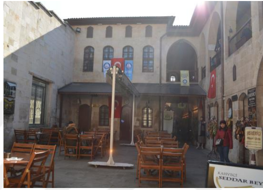
Şekil 4.43. Gümrük Hanı (Altınbaş, 2020)

Müzedede, “Sedef Odası”, “Kırklık Odası”, “Gaziantep Kitapları Odası”, “Bakır İşleme Atölyesi”, “Kilim Dokumacılığı Odası”, “Kutnu Dokumacılığı Odası”, “Osmanlı Dibek Kahvecisi”, “Ebru Odası”, “Antep İşi Atölyesi”, “Ahşap İşleri Odası”, “Hattat Odası”, “Hamam Kültürü Odası”, “Antik Sanatlar Odası”, “Üfleme Cam Odası”, “Tespih Odası”, “Gümüş İşleme Odası”, “Misafir Odası” ve “Geleneksel Gelinlikler Odası”, olup 18 bölümden oluşmaktadır.