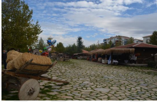
Őekil 4.11. K y meydanı (Altınbař, 2020)

Bu k yde, koyunları, kuzuları, inekleri otlatan oban, buđday tarlasında alıřan ifti, nalbant, demirci, dokumacı, kalaycı, deđirmenci, k y muhtarı, bakkal, kahveci gibi bir Anadolu k y nde olması gereken her Őey bulunmakta ve aslına uygun yařatılmaktadır (Őekil 4.11, 4.12 ve 4.13).