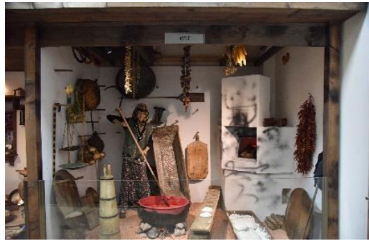
Şekil 4.84. Mutfak

Müze bünyesinde yer alan “Şehir Kahvesi”, “Avlu”, “Mutfak”, “Kına Gecesi”, “Gelin Odası”, “Misafir Odası” gibi bölümlerde şehrin sosyal-kültürel yaşantısı anlatılmaktadır. Bu odalar da cam bölmeler arkasında sergilenmektedir (Şekil 4.84, 4.85).