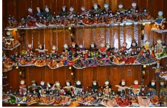
Şekil 4.45. Kırklık odası (Altınbaş, 2020)

Müzenin avlu kısmında Osmanlı Dibek Kahvecisi Odası ve insanların çay ve kahve içebileceği bir oturma alanı bulunmaktadır. Ayrıca, bu kısımda bulunan odalardan; Kutnu Dokumacılığı Odası'nda kutnu kumaşı hakkında bilgi verilmekte ve kumaş satışı yapılmaktadır (Şekil 4.46). Kilim Dokumacılığı Odası'nda yöre kilimleri dokuması yapılmakta iken, Dokuma ustasının vefatından sonra bu oda aktif olarak kullanılmamaktadır. Yemeni Odası'nda “yemeni” (üstü kırmızı yada siyah deriden, tabanı köseleden dikilen topuksuz ayakkabı) hakkında bilgi verilmekte ve satışı yapılmaktadır (Şekil 4.47) (Anonim, 2013: 36) . Avlu kısmında ise yöre yemeklerinin sunulduğu bir restaurant bulunmaktadır.