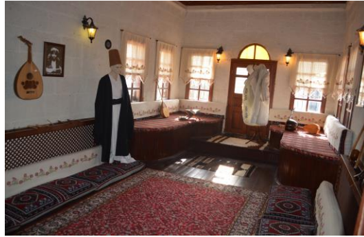
Şekil 4.31. Âşık odası (Altınbaş, 2020)

almakta ve aynı zamanda bir gramofon eşliğinde plaktan bu ozanların türküleri dinletilmektedir. Ayrıca, bu odada âşıklık geleneğine ait âşık atışması da canlandırılmaktadır (Şekil 4.31).