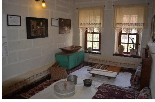
Şekil 4.25. Tafana odası (Altınbaş, 2020)

Halk Hekimliği ve İnanışları Odası'nda şifalı bitkiler hakkında bilgi verilmektedir. Bununla beraber bu odada, zamanında el almış/ocaklı kişiler tarafından uygulanan kurşun dökme işlemi de canlandırılmaktadır. Bugün müzede kurşun dökme işlemini Türk Halk Bilimi konusunda eğitim gören ve müzede görevli olan öğrenciler gerçekleştirmektedir. İsteyen ziyaretçiler ücret karşılığında nazara karşı kurşun dökme deneyimini yaşamaktadırlar (Şekil 4.26).