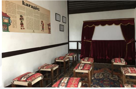
Şekil 4.41. Karagöz odası