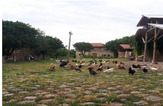
Şekil 4.71. Meydandan bir görüntü

Müze yerleşkesinde bu yapıların yanı sıra Çamaşırhane, Pekmezlik, Çarşı, Mahalle Fırını, Köy Çeşmesi, Mescit, Türbe gibi yapılar ile Köy Bostanı ve Oyun Alanı da yer almaktadır (Şekil 4.71). Müzede yer alan fırında ekşi maya ile oluşturulan yerel ekmekler yapılmaktadır. Bostan, müzenin en önemli üretim alanıdır. Burada yetiştirilen sebze ve meyveler, müzenin yeme-içme ihtiyaçları için hizmet veren mutfaklarda kullanılmaktadır. Ayrıca, bostandan toplanan sebzelerle turşular, salçalar ve reçeller hazırlanmaktadır.