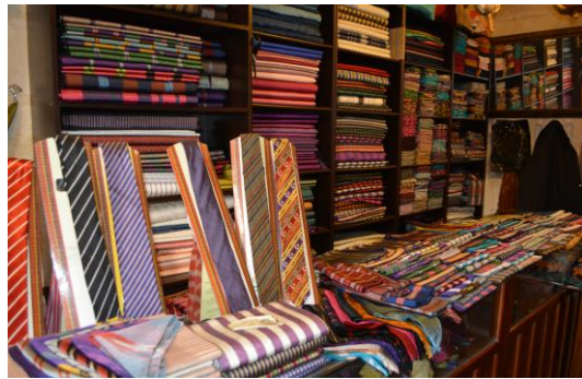
Şekil 4.46. Kutnu dokumacılığı odası (Altınbaş, 2020)

Müzenin avlu kısmında Osmanlı Dibek Kahvecisi Odası ve insanların çay ve kahve içebileceği bir oturma alanı bulunmaktadır. Ayrıca, bu kısımda bulunan odalardan; Kutnu Dokumacılığı Odası'nda kutnu kumaşı hakkında bilgi verilmekte ve kumaş satışı yapılmaktadır (Şekil 4.46). Kilim Dokumacılığı Odası'nda yöre kilimleri dokuması yapılmakta iken, Dokuma ustasının vefatından sonra bu oda aktif olarak kullanılmamaktadır. Yemeni Odası'nda “yemeni” (üstü kırmızı yada siyah deriden, tabanı köseleden dikilen topuksuz ayakkabı) hakkında bilgi verilmekte ve satışı yapılmaktadır (Şekil 4.47) (Anonim, 2013: 36) . Avlu kısmında ise yöre yemeklerinin sunulduğu bir restaurant bulunmaktadır.