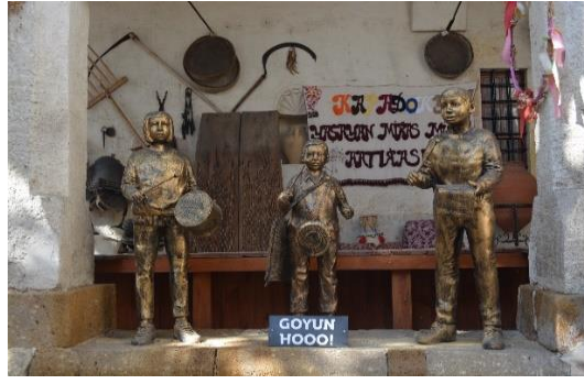
Şekil 4.21. Goyun Hoo heykeli (Altınbaş, 2020)

“Goyun hoo” geleneğinde; Kadir gecesinde ellerinde poşet ve kaplarla sokağa çıkan ve davul çalarak mahalle mahalle gezerek evleri dolaşan çocuklara, yöre halkı şeker, para ve lokum ikram ederler. Evlere ziyarete giderken çocuklar aynı zamanda “ goyun hoo, goyun hoo, biz geldik duyun hoo, verdiyseniz verdiniz, vermediyseniz testinizi, çanağınızı kırarız hoo ” şeklinde bir tekerleme söylerler. Çocuklar ev sahibinden, şeker, para veya lokum alamazlar ise evin önünde bulunan çanak ve çömlekleri kırarlar.