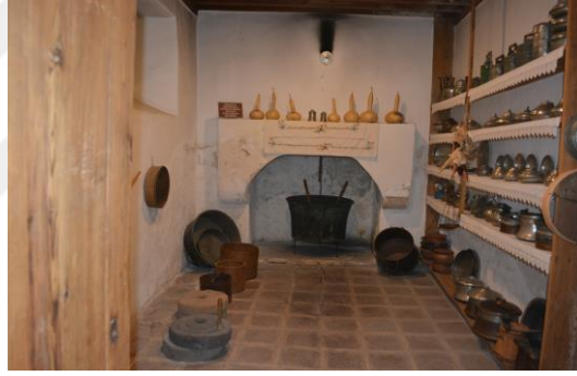
Şekil 4.4. Kışlık mutfak (Altınbaş, 2020)

Müzenin giriş katında yer alan hayat kısmında, Mahzen Odası bulunmaktadır. Bu oda gıdaların korunması için soğuk hava deposu olarak kullanılmıştır. Ayrıca, konakta olası bir yangın tehlikesine karşı değerli eşyalar da bu odada saklanmaktadır. Kışlık mutfak odasında yakın zamana kadar kullanılan mutfak kapları sergilenmektedir (Şekil 4.4).