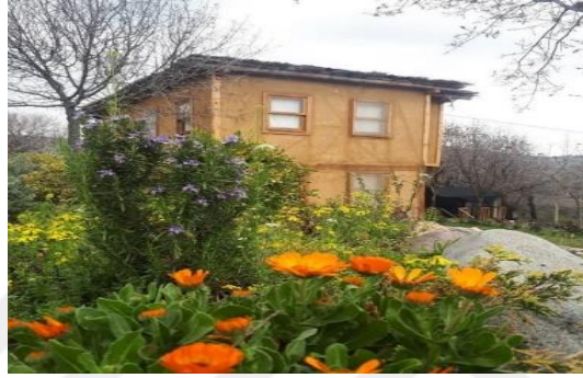
Şekil 4.70. Kerpiç ev tipi

Müze yerleşkesinde bu yapıların yanı sıra Çamaşırhane, Pekmezlik, Çarşı, Mahalle Fırını, Köy Çeşmesi, Mescit, Türbe gibi yapılar ile Köy Bostanı ve Oyun Alanı da yer almaktadır (Şekil 4.71). Müzede yer alan fırında ekşi maya ile oluşturulan yerel ekmekler yapılmaktadır. Bostan, müzenin en önemli üretim alanıdır. Burada yetiştirilen sebze ve meyveler, müzenin yeme-içme ihtiyaçları için hizmet veren mutfaklarda kullanılmaktadır. Ayrıca, bostandan toplanan sebzelerle turşular, salçalar ve reçeller hazırlanmaktadır.