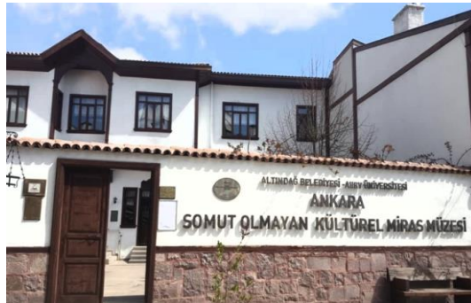
Şekil 4.74. Müze binası