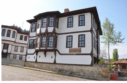
Şekil 4.32. Müze binası

Konakta, “Yönetim Ofisi”, “Tarım Odası”, “Ekmek Evi”, “Çocuk Atölyesi ve Oyun Odası”, “Baş Oda”, “El Sanatları Odası”, “Gelin Odası”, “Gösteri Sanatları Odası”, “Boyabat Cemberi Odası” ve “Masal Odası” olmak üzere 10 bölüm vardır.