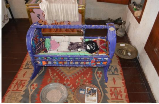
Şekil 4.29. Aynalı beşik (Altınbaş, 2020)

Masal Odası'nda Türk Kültürü'ne ait sözlü gelenek ve anlatılardan bahsedilirken (Şekil 4.30), Sohbet Odası'nda meddah hikâyeleri ile günümüzde geçmişi yaşama imkânı sağlanmaktadır.