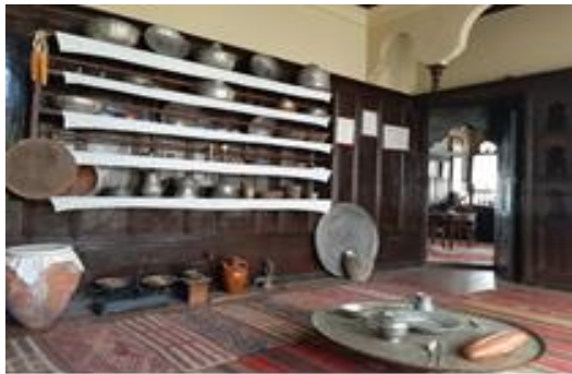
Şekil 4.53. Mutfak odası (Müze arşivi)

Üst katta, Mutfak Odası bölümünde geleneksel yemekler ve bunlar ile ilgili ritüeller müze rehberi eşliğinde anlatılmaktadır (Şekil 4.53).