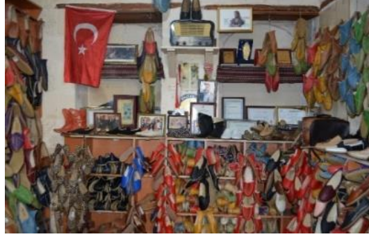
Şekil 4.47. Yemeni odası (Altınbaş, 2020)

Müzenin üst katında yer alan odalardan biri Ahşap İşleri Odasıdır. Ahşap işleri odasında ahşap oymacılığı hakkında bilgi verilmekte ve hediyelik eşyalar satılmaktadır (Şekil 4.48). Diğer oda olan Hattat Odası'nda; hat yapımı izlenmekte ve bilgi alınmaktadır. Ayrıca bu odada üretilen eserler satışa sunulmaktadır (Şekil 4.49).