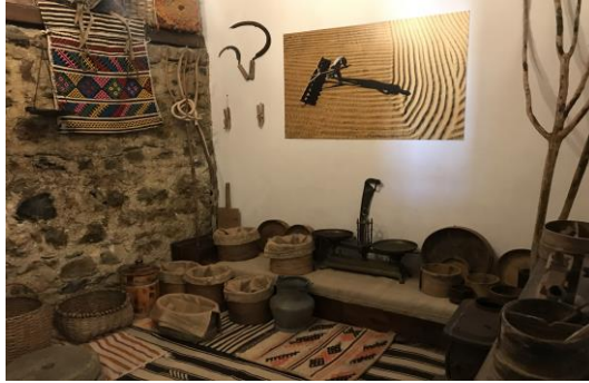
Şekil 4.33. Tarım odası

Yönetim Ofisi, İdari işlerin yürütüldüğü odadır. Tarım Odası, Boyabat’ın geleneksel tarım ürünlerinin ve tarım aletlerin sergilendiği bölümdür (Şekil 4.33). Burada çeşitli deyimlere ve atasözlerine yer verilmektedir. Ayrıca, geleneksel yağmur duasından da bahsedilmektedir.