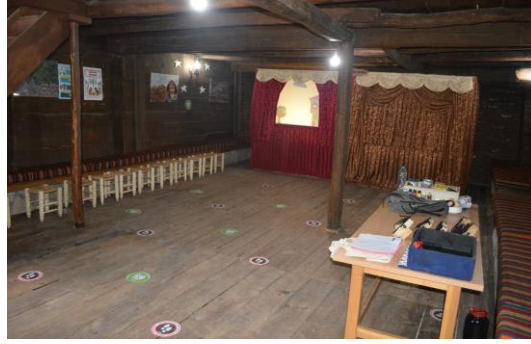
Őekil 4.18. Çocuk etkinlik evi (AltınbaŐ, 2020)

Müzenin amaŐırhane kısmında köy hayatında kadınların bir araya gelerek amaŐır yıkama faaliyetleri canlandırılmaktadır. amaŐırlar, aynı Őekilde, müzede oluřturulan ortamda, odun ateŐinde ısıtılan suyla yalak üzerinde tokala vurularak yıkanmakta isteyen ziyaretiler bu etkinliĐe katılmakta ve deneyimleyebilmektedir (Őekil 4.19).