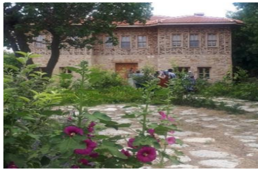
Şekil 4.68. Gözdolma ev tipi