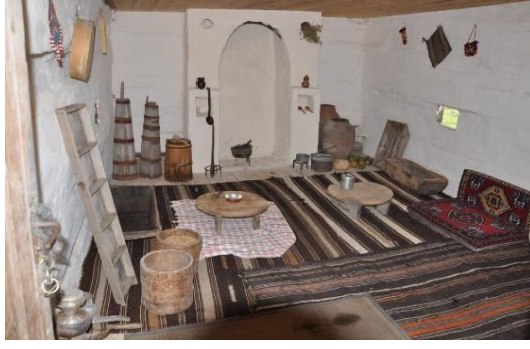
Şekil 4.89. Mutfak ( https://www.bursamuze.com/arkeopark-acik-hava-muzesi-513/ - Erişim Tarihi: 11-02-2021).