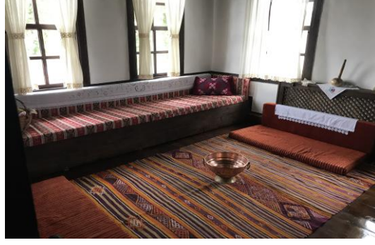
Şekil 4.40. Masal odası