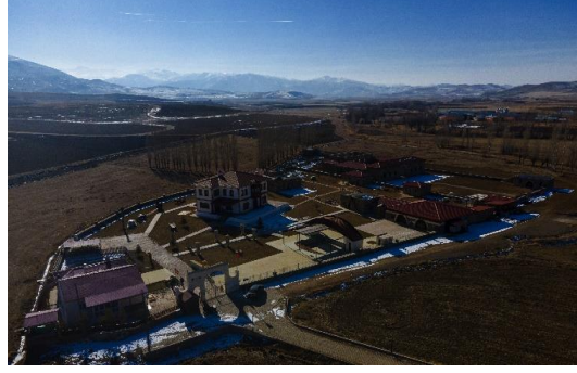
Şekil 4.56. Müzenin görünüşü

Müzedede, “Loru Han”, “Kapalı Sergi Salonları”, “Açık Sergi Alanları”, “Köy Evi”, “Su Değirmeni”, “Bezir Yağı Değirmeni”, “Amfi Tiyatro”, “Kütüphane/Toplantı Salonu”, “Geleneksel Çarşı”, “Köy Meydanı”, “Aşhane”, “Mescit”, “Gecekondu”, “Konak”, “Tandırılık”, “Kuş Evi”, “Geleneksel Çocuk Oyun Alanı”, “Çay Evi” ve “Seyir Terası” olmak üzere 19 bölüm bulunmaktadır. Müze bir anlatıcı nezaretinde gezilmektedir.