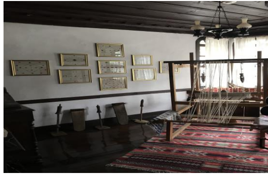
Şekil 4.39. Boyabat çemberi odası

Yöresel dokuma ürünü olan Boyabat Çemberi hakkında bilgilere ve uygulama kısmını Boyabat Çemberi odasında ziyaretçi deneyimlemektedir (Şekil 4.39). Masal odasında çeşitli enstrümanlar kullanılarak Türk masalları rehberler tarafından anlatılmaktadır (Şekil 4.40). Gösteri sanatları bölümünde başta Karagöz olmak üzere orta oyunu, köy seyirlik oyunu, meddah gösterileri yapılmaktadır (Şekil 4.41).