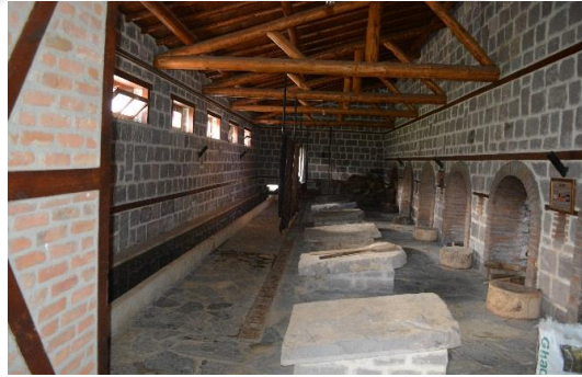
Őekil 4.19. amaŐırhane (AltınbaŐ, 2020)

Müzenin amaŐırhane kısmında köy hayatında kadınların bir araya gelerek amaŐır yıkama faaliyetleri canlandırılmaktadır. amaŐırlar, aynı Őekilde, müzede oluřturulan ortamda, odun ateŐinde ısıtılan suyla yalak üzerinde tokala vurularak yıkanmakta isteyen ziyaretiler bu etkinliĐe katılmakta ve deneyimleyebilmektedir (Őekil 4.19).