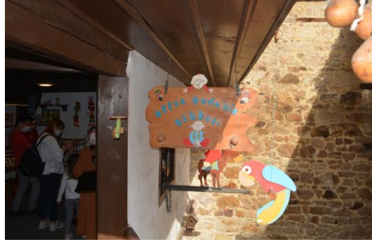
Şekil 4.2. Affan dedenin dükkânı (Altunbaş, 2020)

Müze girişte ilk olarak oyuncakçı Affan Dede'nin dükkânı görülmektedir. Burada ahşaptan yapılmış kültürümüzü yansıtan oyuncaklar sergilenmekte ve satılmaktadır (Şekil 4.2). Müzenin avlu kısmına gelindiğinde ise taş fırın, çay bahçesi ve mutfak yer almaktadır.