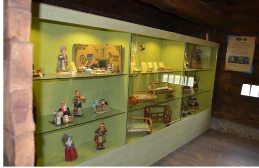
Şekil 4.15. Oyuncak müzesi (Altınbaş, 2020)

bulunmaktadır. Ayrıca müze bünyesinde yer alan, “Yaban Hayatı Tanıtım Müzesi” de açık hava müzesinin görülmesi gereken özel yerlerinden biridir (Şekil 4.15, 4.16 ve 4.17).