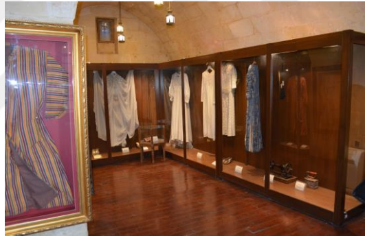
řekil 4.51. Geleneksel gelinlikler odası (Altınbař, 2020)