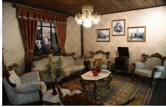
Şekil 4.86. Cumhuriyet odası

Cumhuriyet Odası bölümü, Ulu Önder Mustafa Kemal Atatürk ve İstanbul Heyetinin ilk resmi görüşmesi olan Bilecik Mülakatı'na ithafen kurulmuştur (Şekil 4.86).