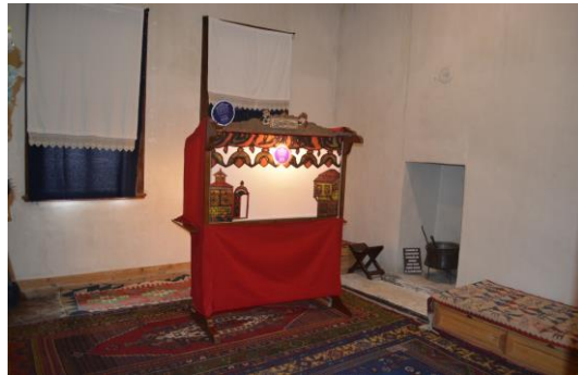
Şekil 4.8. Karagöz odası (Altınbaş, 2020)

Bu katta yer alan Masal Odasında, Anadolu'nun farklı yörelerine ait masallar ve maniler yediden yetmişe herkesin kolaylıkla anlayabileceği bir dilde ‘Masal Ebeleri’ tarafından anlatılmaktadır. Masal ebeleri ziyaretçilere bilmece de sormakta ve bilmeceyi cevabını doğru bilene bir şeker hediye etmektedir. Aynı katta yer alan Karagöz Odası’nda gölge oyunları sergilenmektedir (Şekil 4.8).