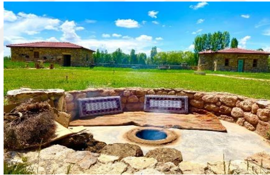
Şekil 4.66. Tandırlık

Ziyaretçilerin ve yöredeki çocukların oynayıp eğleneceği bir mekân olarak Geleneksel Çocuk Oyun Alanı tasarlanmıştır. Müzede sosyal yaşamın önemli bir parçası olan toprak dam yani bir seyir terası vardır. Yöreyle ait ağız barı geleneği bu mekânda yaşatılmaktadır. Ağız barı; düğünlerde damat evinin toprak damında erkeklerin müziksiz olarak söyleyip oynadıkları bir horondur.