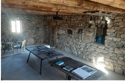
Şekil 4.61. Kütüphane (Müze arşivi, 2020)

Kütüphane / Toplantı Salonu bölümünde Bayburt'un tarihi, kültürel ve edebiyat yaşamını anlatan kitapların yanı sıra Türk kimliğinin klasikleri olan fikir, roman ve çocuk masallarından oluşan bir kütüphanedir. Ayrıca bu mekan, toplantı salonu ve masal odası olarak da kullanılmaktadır (Şekil 4.61).