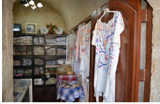
řekil 4.50. Hamam kùltürü odası (Altınbař, 2020)

Hamam Kùltürü Odası'nda hamam kùltürüne ait peřtamal, takunya ve havlular satılmaktadır (řekil 4.50). Ziyaretçiler Ebru Odası'nda az bir ücret karřılıęında deneyerek ebru yapmayı öęrenmektedir. Geleneksel Gelinlikler Odası'nda Gaziantep'li kadınların sergilenmek üzere baęıřladıęı farklı tarihlere ait gelinlikler ve gelin takunyaları bulunmaktadır (řekil 4.51).