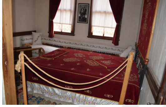
Şekil 4.9. Gelin odası (Altınbaş, 2020)

Oyun Odası'nda unutulmaya yüz tutmuş oyunlar anlatılmakta ve isteyen ziyaretçilerle bu oyunlar oynanmaktadır. Bu katta son oda Gelin Odası'dır. Bu odada evlilik yaşamı içerisinde yer alan gelenekler aktarılmakta ve zaman zaman çeyiz serme geleneği canlandırılmaktadır (Şekil 4.9).