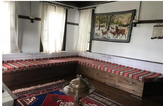
Şekil 4.36. Baş oda (Müze arşivi, 2020)

Baş Oda kısmında, sohbet gelenekleri, Boyabat'ın geleneksel meslekleri, Boyabat ve çevresi hakkında bilgi verilmektedir. El sanatları odasında ziyaretçi, ihlamur baskı, ebru sanatı ve birçok geleneksel sanatlar hakkında bilgi sahibi olup deneyimlemektedir. Gelin odası bölümünde ise geçiş dönemlerinin yanı sıra, çeyiz, geleneksel giyim-kuşam ve bağlamına uygun birçok sözlü kültür ürününün aktarımı yapılmaktadır (Şekil 4.36, 4.37 ve 4.38).