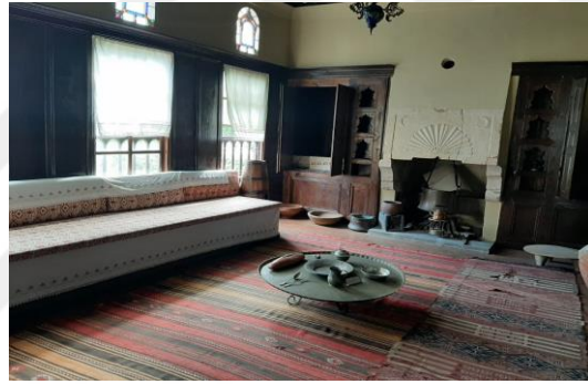
Şekil 4.55. Kaptan odası