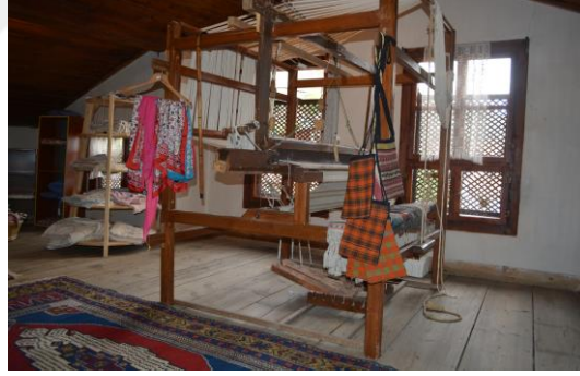
Şekil 4.10. Dokuma odası (Altınbaş, 2020)

Konağın son katında bulunan Dokuma Odası'nda yöresel bazı halılar sergilenmektedir Ayrıca ziyaretçiler mekikli dokuma tezgâhında düğüm atma deneyimini yaşamaktadır (Şekil 4.10). Bu odada hediyelik dokuma ürünlerin satışı da yapılmaktadır.