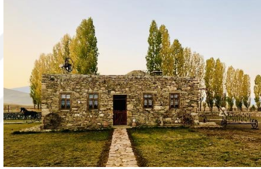
Şekil 4.58. Köy evi

Köy evi, Anadolu insanının günlük yaşamını anlatan yerdir (Şekil 4.58). Bu ev Müze kurucusu Kenan YAVUZ'un doğup büyüdüğü ve beş kuşaktır ailesi tarafından kullanılan bir evdir.