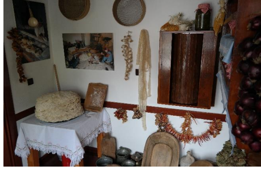
Şekil 4.76. Mutfak

Muhabbet Odası bölümünde birçok hikâye, müze ziyaretçilerine anlatılmaktadır. Ayrıca, 'Ferfene' adıyla yaşatılan sohbet toplantılarından da bahsedilmektedir.