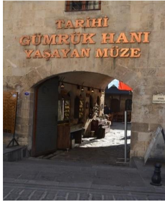
Şekil 4.42. Giriş kapısı (Altınbaş, 2020)