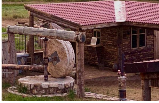
Şekil 4.60. Beziryığı değirmeni (Müze arşivi, 2020)

Yöre insanının sosyalleşmesi, yaşam kalitesini arttırmak ve gelen ziyaretçilerin keyifli vakit geçirmesi amacı ile inşa edilen Amfi Tiyatro bölümünde konser, sinema, ve çeşitli etkinlikler yapılmaktadır.