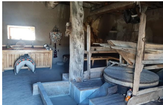
Şekil 4.59. Su değirmeni

Müzede yer alan Su Değirmeni bölgede bulunan Demirözü baraj gölü altından çıkarılarak müzeye taşınmıştır (Şekil 4.59).