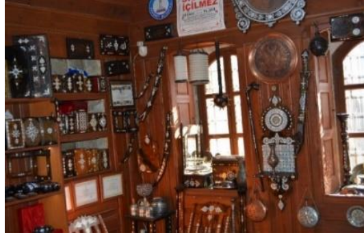
Şekil 4.44. Sedef odası (Altınbaş, 2020)