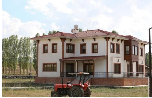
Şekil 4.65. Konak

Bayburt'un yöresel mimarisinden esinlenerek inşa edilen konak bölümü ise bir kültür ve yaşam merkezidir (Şekil 4.65). Konak köyün bayramlaşma ve taziye yeri olarak ta kullanılmaktadır. Tandırlık, Anadolu evlerinin en sıcak bölümüdür. Ekmek yapımı için bir ocak bir fırın olarak kullanılmaktadır. Etkinlik yapılabilmesi için açık alanda inşa edilmiştir (Şekil 4.66). Ayrıca Bayburt'ta yaşayan endemik bir güvercin türünü tanıtmak için müzede bir Kuş Evi bulunmaktadır.