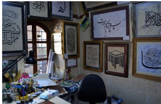
Şekil 4.49. Hattat odası (Altınbaş, 2020)

Bu katta, Antik Sanatlar Odası'nda cam mozaik eşyalar satılmaktadır. Antep İşi El İşleme Atölyesi'nde, yöreye özgü Antep işi nakışlar sergilenmektedir. Üfleme Cam Odası, Tespih Odası ve Gümüş İşleme Odaları'nda ise yine hediyelik eşyalar satılmaktadır.