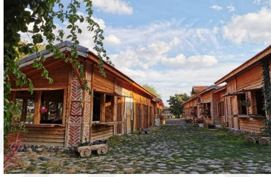
Şekil 4.72. Anadolu çarşısı (Müze arşivi, 2020)

Anadolu Çarşısı olarak düzenlenen çarşının yapımında eski Bursa çarşısı esas alınmıştır (Şekil 4.72). Bu çarşı içerisinde aynı zamanda hediyelik eşya dükkanları ve atölyeler bulunmaktadır. Bu dükkan ve atölyelerde geleneksel mesleklere ilişkin bir sergileme yapılmaktadır. Bunlar Ihlamur Baskı, Ebru Sanatı ve Bakır İşlemeciliğidir. Aynı zamanda ziyaretçiler bu el sanatlarını deneyimleyebilmektedir.