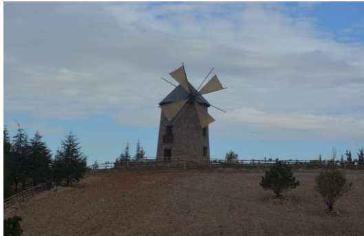
Őekil 4.12. Deđirmen (Altınbař, 2020)