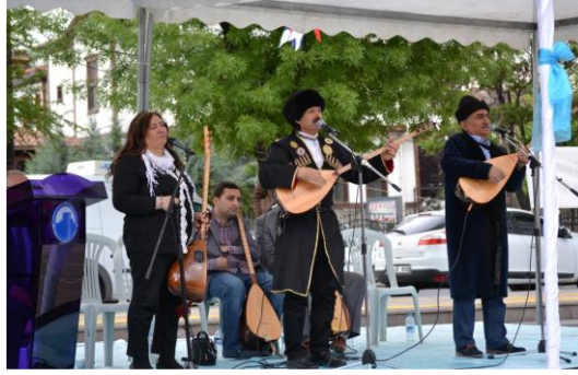
Şekil 4.78. Hıdırellez şenlikleri (Müze arşivi, 2020)

Drama Atölyesi” gibi günlük etkinlikler yapılırken “Çiğdem Günü”, “Hıdırellez Şenliği”, “Aşure Günü” gibi dönemsel etkinlikler de gerçekleştirilmektedir (Şekil 4.78).