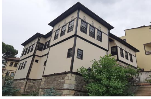
Şekil 4.52. Ünye Belediyesi yaşayan kültürel miras müzesi

Müzedede, “Ömer ÇAM-Gösteri Sanatları Odası”, “Murat YILMAZ- El Sanatları Odası”, “Personel Odası”, “Yusuf Bahri Efendi Odası”, “Baş Oda”, “Mutfak Odası” ve “Meliha-Ali Rıza ERÜŞ Odası” olmak üzere 7 bölüm bulunmaktadır.