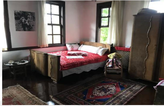
Şekil 4.38. Gelin odası

Yöresel dokuma ürünü olan Boyabat Çemberi hakkında bilgilere ve uygulama kısmını Boyabat Çemberi odasında ziyaretçi deneyimlemektedir (Şekil 4.39). Masal odasında çeşitli enstrümanlar kullanılarak Türk masalları rehberler tarafından anlatılmaktadır (Şekil 4.40). Gösteri sanatları bölümünde başta Karagöz olmak üzere orta oyunu, köy seyirlik oyunu, meddah gösterileri yapılmaktadır (Şekil 4.41).