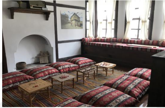
Şekil 4.35. Çocuk atölyesi ve oyun odası

Baş Oda kısmında, sohbet gelenekleri, Boyabat'ın geleneksel meslekleri, Boyabat ve çevresi hakkında bilgi verilmektedir. El sanatları odasında ziyaretçi, ihlamur baskı, ebru sanatı ve birçok geleneksel sanatlar hakkında bilgi sahibi olup deneyimlemektedir. Gelin odası bölümünde ise geçiş dönemlerinin yanı sıra, çeyiz, geleneksel giyim-kuşam ve bağlamına uygun birçok sözlü kültür ürününün aktarımı yapılmaktadır (Şekil 4.36, 4.37 ve 4.38).