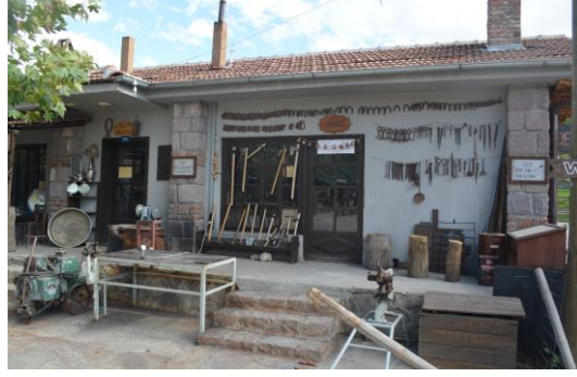
Şekil 4.13. Demirci, Kalaycı (Altınbaş, 2020)

Altınköy açık hava müzesinde bulunan konaklar, batı Karadeniz’de bulunan metruk çantı evlerin taşınıp burada restore edilmesiyle oluşturulmuştur (Yenigül ve Silav, 2019: 529).