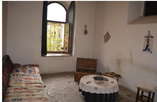
Şekil 4.5. Halk inanışları odası (Altınbaş, 2020)

Kışlık mutfağın yan tarafında zamanında kiler olarak kullanılan kısım Halk İnanışları Odası olarak faaliyet göstermekte ve burada isteyen ziyaretçiler ücret karşılığında nazara karşı kurşun dökürmektedirler (Şekil 4.5).