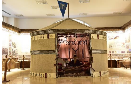
Şekil 4.80. Kıl çadır (Müze arşivi, 2020)

Müzenin giriş katında bulunan diğer bölümde Milli Mücadeleye damga vuran I. İnönü, II. İnönü, Metristepe Zaferlerinin yaşandığı ve düşmana Türklerin esaret altında yaşayamayacakları, vatanları için gerekirse canlarını feda edecekleri dersinin verildiği bir “Kurtuluş Odası” yer almaktadır (Şekil 4.81).