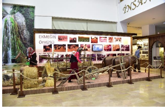
Şekil 4.81. Kurtuluş bölümünden (Müze arşivi, 2020)

Müzenin giriş katında bulunan diğer bölümde Milli Mücadeleye damga vuran I. İnönü, II. İnönü, Metristepe Zaferlerinin yaşandığı ve düşmana Türklerin esaret altında yaşayamayacakları, vatanları için gerekirse canlarını feda edecekleri dersinin verildiği bir “Kurtuluş Odası” yer almaktadır (Şekil 4.81).