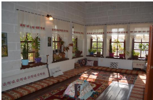
Şekil 4.30. Masal odası (Altınbaş, 2020)

Masal Odası'nda Türk Kültürü'ne ait sözlü gelenek ve anlatılardan bahsedilirken (Şekil 4.30), Sohbet Odası'nda meddah hikâyeleri ile günümüzde geçmişi yaşama imkânı sağlanmaktadır.