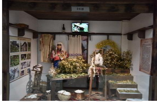
Şekil 4.83. İpekçi

Müze bünyesinde yer alan “Şehir Kahvesi”, “Avlu”, “Mutfak”, “Kına Gecesi”, “Gelin Odası”, “Misafir Odası” gibi bölümlerde şehrin sosyal-kültürel yaşantısı anlatılmaktadır. Bu odalar da cam bölmeler arkasında sergilenmektedir (Şekil 4.84, 4.85).