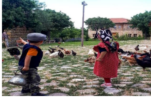
Şekil 4.73. Köyde bir gün (Müze arşivi, 2020)

Müze, ekonomik, çevresel ve kurumsal sürdürülebilir temeller üzerine kuruludur. Müzenin ekonomik sürdürülebilirliği müze giriş ücreti, hediyelik ürünler, bostanda üretilen sebzeler, yeme-içme hizmetleri, konaklama, uygulamalı tematik etkinlikler yoluyla sağlanır. Hediyelik ürünler arasında sepetler, seramik ve cam işi ürünler yer alır. Böylelikle müzede bir yandan özgün hediyeliklere yer verilirken diğer yandan el emeğine dayalı, küçük üretim yapan ustalara destek olunmaktadır. Geleneksel tarım uygulamalarının yer aldığı bostanda yerel tohum ve hayvansal gübre kullanılarak sürdürülebilir tarım ve çevre politikalarına katkıda bulunulur.