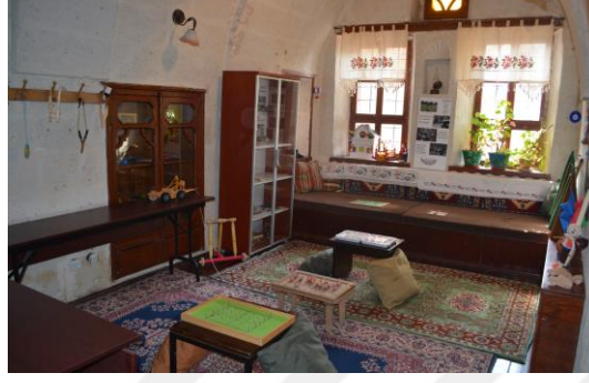
Şekil 4.23. Çocuk oyunları odası (Altınbaş, 2020)

Çocuk Oyunları Odası'nda ise ziyaretçilere “mangala”, “beştaş”, “çelik çomak”, “koz” ve “aşık” gibi geleneksel çocuk oyunlarının nasıl oynandığı ve bu oyunlar ile ortaya çıkmış “koz vermek”, “aşık atmak” gibi deyimlerin hikayesi anlatılmaktadır (Şekil 4.23).