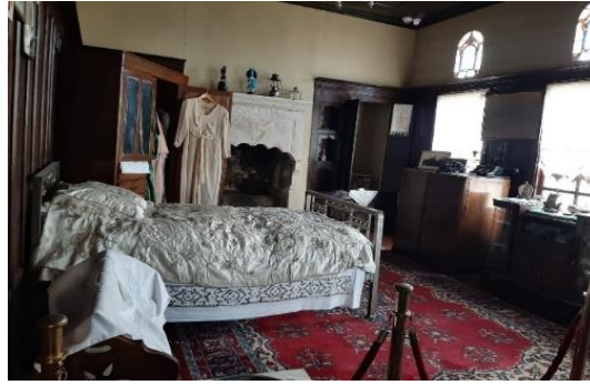
Şekil 4.54. Meliha-Ali Rıza Erüş odası

gibi geiş dnemlerinde uygulanan halk inanışlarından bahsedilmektedir (Şekil 4.54). Kaptan Odası'nda ise sözlü kültürümüzden deyimler, atasözleri ve bunların hikâyeleri anlatılmaktadır (Şekil 4.55).