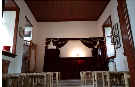
Şekil 4.75. Gösteri sanatları bölümü

Gösteri Sanatları bölümünde Karagöz, Orta Oyunu ve Meddahlık geleneği anlatılmaktadır. Ayrıca, Karagöz Oyunu da oynatılmaktadır. Ziyaretçiler isterler ise “Hayali” ve “Yardak” olmayı deneyimleyebilmektedirler. Meddah, canlandırma teknikleri ve kostümüyle, ziyaretçilere hikâyeler anlatmaktadır (Şekil 4.75).