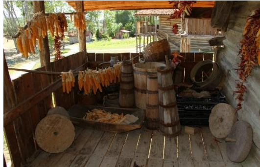
Şekil 4.88. Köy Evi'nden bir görüntü ( https://www.bursamuze.com/arkeopark-acik-hava-muzesi-513/ - Erişim Tarihi: 11-02-2021).