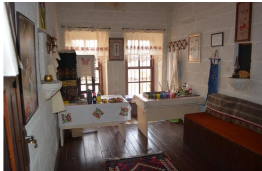
Şekil 4.27. El sanatları odası (Altınbaş, 2020)

El Sanatları Odası'nda ziyaretçiler ebru sanatı, ihlamur ağacı baskısı ile masa örtüsü süsleme, bez çanta ve mutfak önlüğü yapma şansı bulmakta ve bu el sanatlarının üretim aşamalarını deneyimleyebilmektedirler (Şekil 4.27).