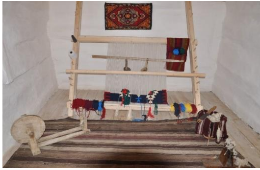
Şekil 4.91. Dokuma Odası ( https://www.bursamuze.com/arkeopark-acik-hava-muzesi-513/ - Erişim Tarihi: 11-02-2021).