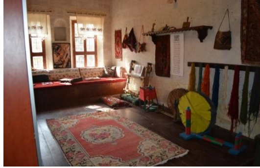
Şekil 4.24. Dokuma odası (Altınbaş, 2020)

Dokuma Odası, gelen ziyaretçilerin Avanos halılarının ipliklerinin eğrilmesinden boyanmasına kadar hazırlık aşamalarını ve ardından da dokuma tekniğini öğrendikleri bir ortamdır. Aynı zamanda ziyaretçiler bir dokuma ustası önderliğinde dokuma tezgâhında düğüm atma deneyimini de yaşamaktadırlar (Şekil 4.24).