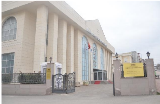
Şekil 4.79. Müze binası

Müze, kuruluş ve kurtuluş şehri olan Bilecik’i “Kuruluş Odası”, “Kurtuluş Odası”, “Zanaat Odası”, “Sosyal Odalar” ve “Cumhuriyet Odası” olmak üzere 5 ana başlık altında tanıtır.