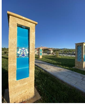
Şekil 4.57. Çini maçin ve kapı

Köy evi, Anadolu insanının günlük yaşamını anlatan yerdir (Şekil 4.58). Bu ev Müze kurucusu Kenan YAVUZ'un doğup büyüdüğü ve beş kuşaktır ailesi tarafından kullanılan bir evdir.