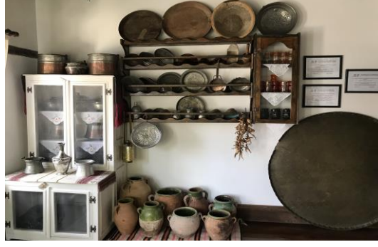
Şekil 4.34. Ekmek evi