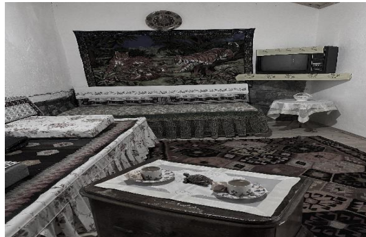
Şekil 4.64. Gecekondü

Aşhane bölümünde yöresel mutfak malzemeleri sergilenmekte, yöresel olarak hazırlanan ürünlerin de satışı yapılmaktadır. Müze bünyesinde köyden kente göçü simgeleyen bir gecekondü da yer almaktadır (Şekil 4.64).