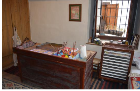
Şekil 4.6. El sanatları odası (Altınbaş, 2020)

Ayrıca hayat kısmında geleneksel bir de El Sanatları Odası bulunmaktadır. Bu odada, ıhlamur baskı ile desenlendirilmiş örtü vb. çeşitli kumaş ürünler ve ebru yapılmaktadır (Şekil 4.6).