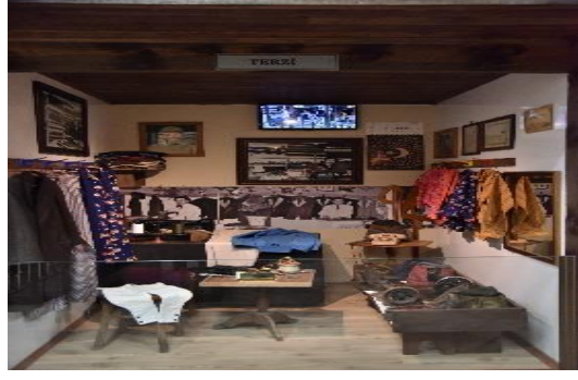
Şekil 4.82. Terzi