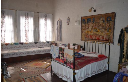
Şekil 4.28. Gelin odası (Altınbaş, 2020)

Gelin Odası'nda düğün geleneklerinden çeyiz serme geleneği anlatıcı nezaretinde tanıtılmakta ve evlilik yaşamı yansıtılmaktadır (Şekil 4.28). Evlilik yaşamı içerisinde geleneksel kullanımı olan, aynalı süpürge ve aynalı beşik de bu odada bulunmakta olup, hikâyeleri de ayrıca anlatıcı tarafından ziyaretçilere aktarılmaktadır (Şekil 4.29).