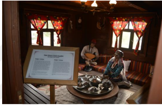
Şekil 4.16. Etnografya müzesi (Altınbaş, 2020)