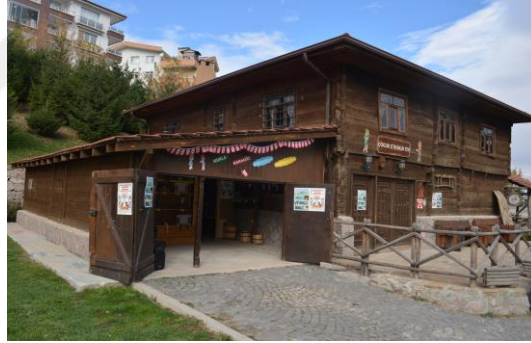
Şekil 4.14. Çantı ev (Altınbaş, 2020)

En az yüz yıllık geçmişi olan bu evler; köy evi yaşantısının canlandırıldığı, ziyaretçilerin yeme içme ihtiyacının karşılandığı, müzede üretilen oyuncak, dokuma gibi ürünler ile eski ev ve iş aletlerinin sergilendiği mekânlar olarak düzenlenmiştir (Şekil 4.14).