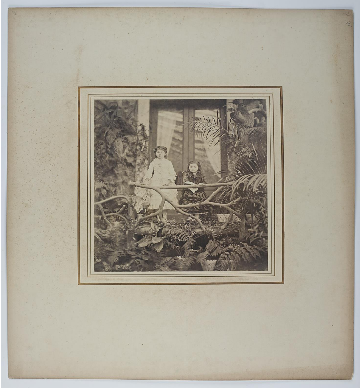
[Yıldız Sarayı bahçesinde Sultanlar], http://nek.istanbul.edu.tr:4444/ekos/FOTOGRAF/90468---0012.jpg