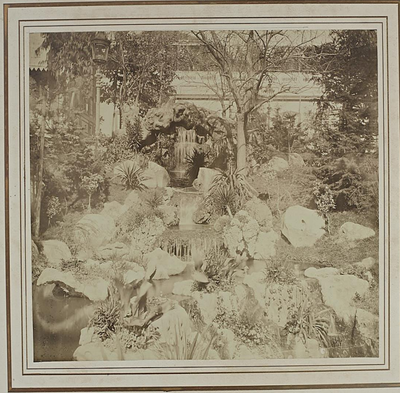
Yıldız Sarayı-Hasbahçeden görünüş