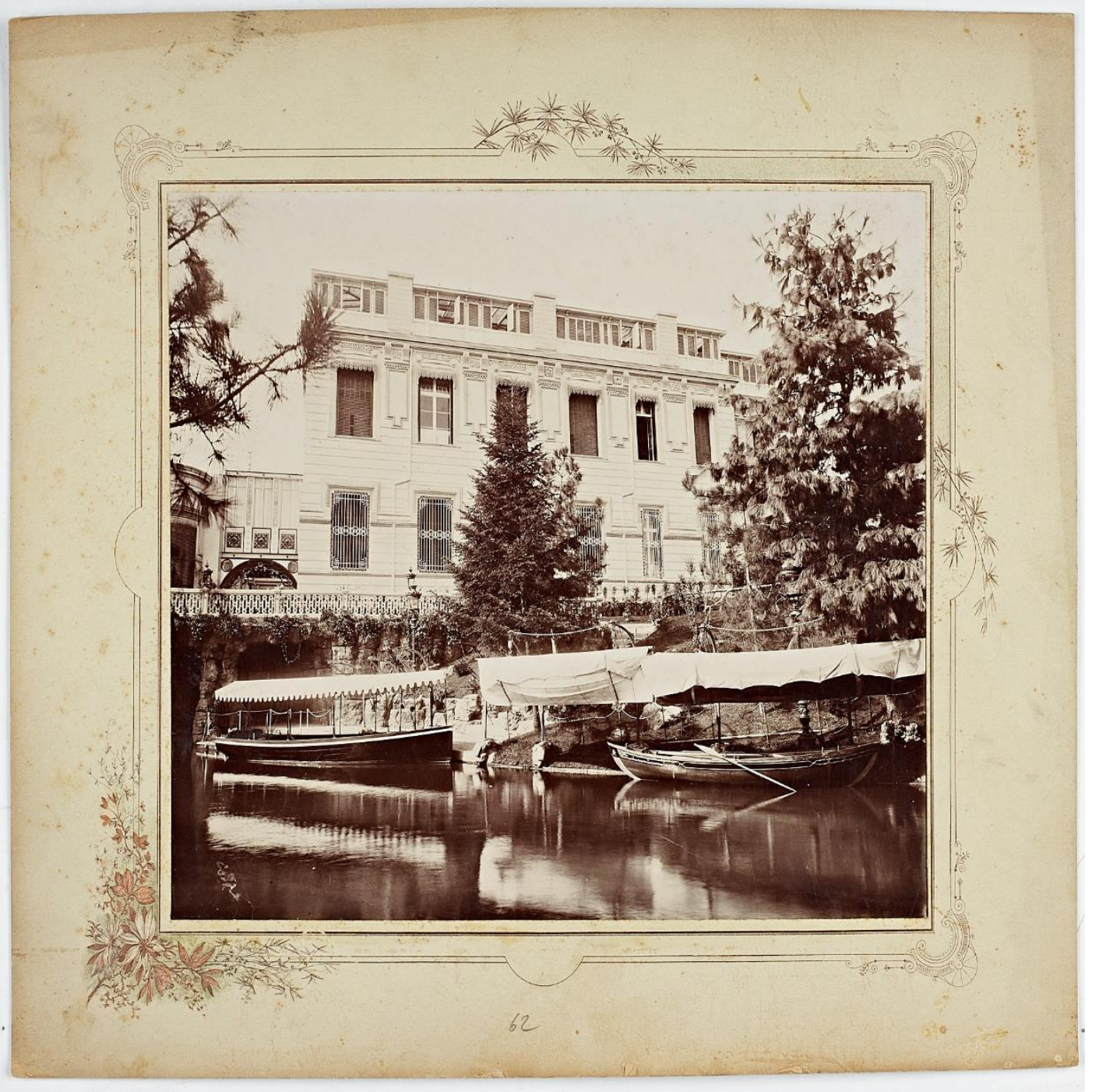
Köşk, II. Abdülhamid'in çalışma, yemek, istirahat, kabul ve yatak odasını bulunduran özel ikametgâhıydı