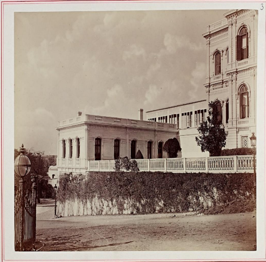
Vue du kiosque annexé au Palais Impérial de Yıldız