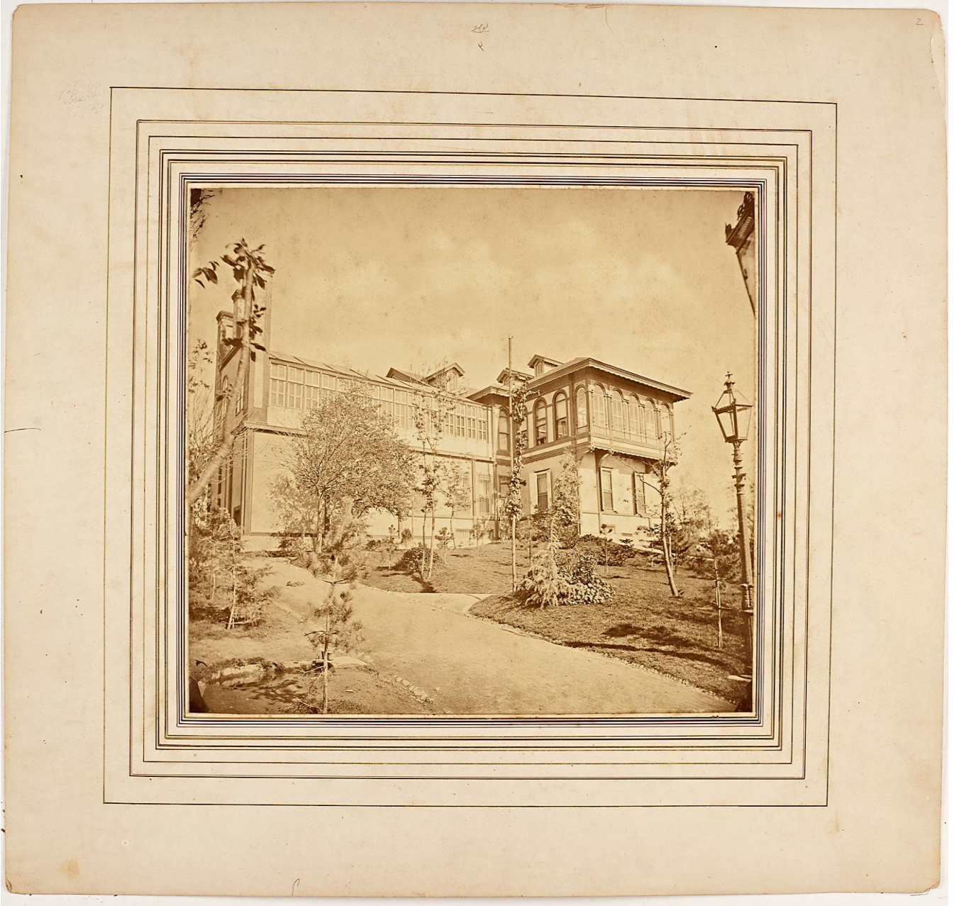
Şale Kasrı'nın dışarıdan görünümü,

http://nek.istanbul.edu.tr:4444/ekos/FOTOGRAF/90853---0002.jpg