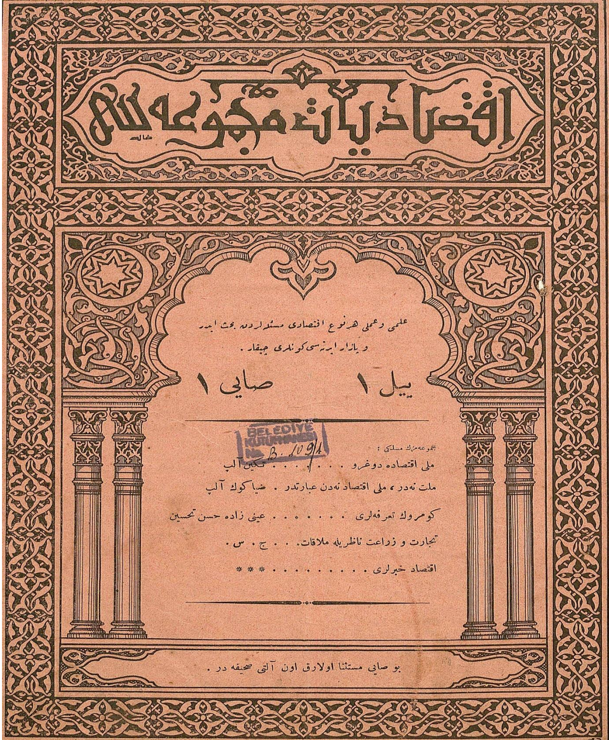
İktisadiyat Mecmuası'nın 21 Şubat 1916 tarihinde yayımlanan birinci sayısının kapağı.